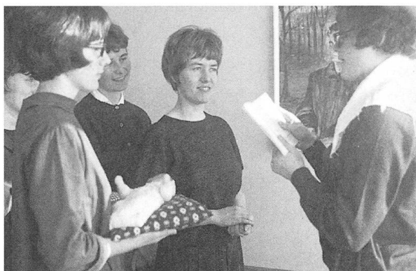
Heidi mit Kolleginnen 1964 im Kindergärtnerinnen-Seminar in Menzingen.

Nach den absolvierten üblichen Schuljahren in Stans verbrachte Heidi ein Jahr im Welschland. Auch dort hatte sie Gelegenheit, neben ihrer Arbeit, sich musikalisch und schauspielerisch zu entfalten, durfte sie mit grosser Begeisterung den Hänsel aus Humperdincks Hänsel und Gretel singen und spielen.