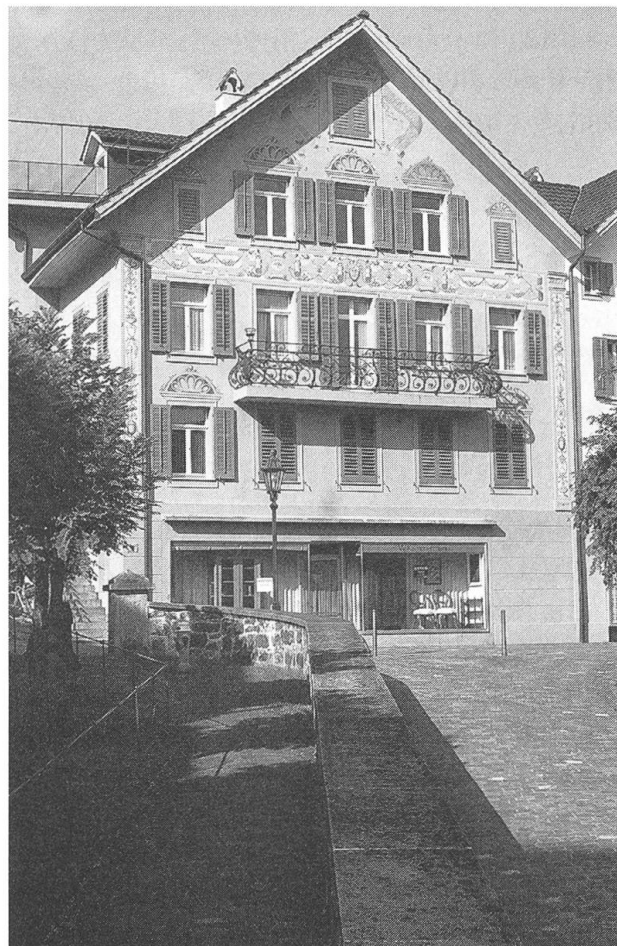
Haus Nägeligasse 3: Aussenansicht mit der erneuerten Fassadenmalerei (Jörg Feierabend, Architekt, Stans)

Um 1720 wurde der Vorgängerbau errichtet, der bis in das ausgehende 19. Jahrhundert als Gasthaus «Oberer Adler» diente. 1725 sind Josef Waser und 1733 vermutlich Viktor Ferdinand Hermann als Besitzer der Liegenschaft nachgewiesen. 1848 erwarb Caspar von Matt das zweite Obergeschoss. Am 31. Mai 1892 brannte das damals im Besitz der Familie Waser befindliche Gebäude nieder und wurde in der Folge über den erhaltenen Resten neu errichtet. 1897 war die Schuhhandlung des