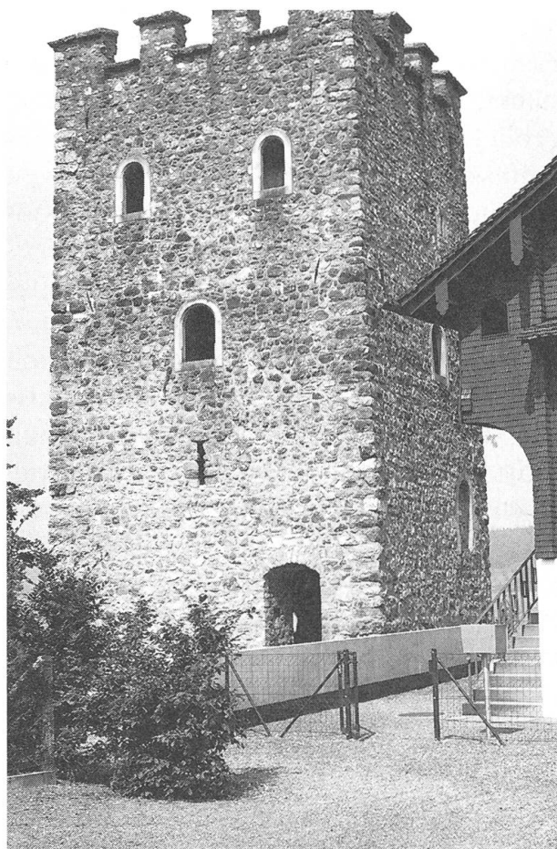
Schnitzturm: Aussenansicht Süden.

Der mittelalterliche Wohnturm, dessen Erbauer unbekannt ist, wurde im 13. oder 14. Jahrhundert als Hauptbau im Zentrum einer kleinen Burganlage errichtet. Die