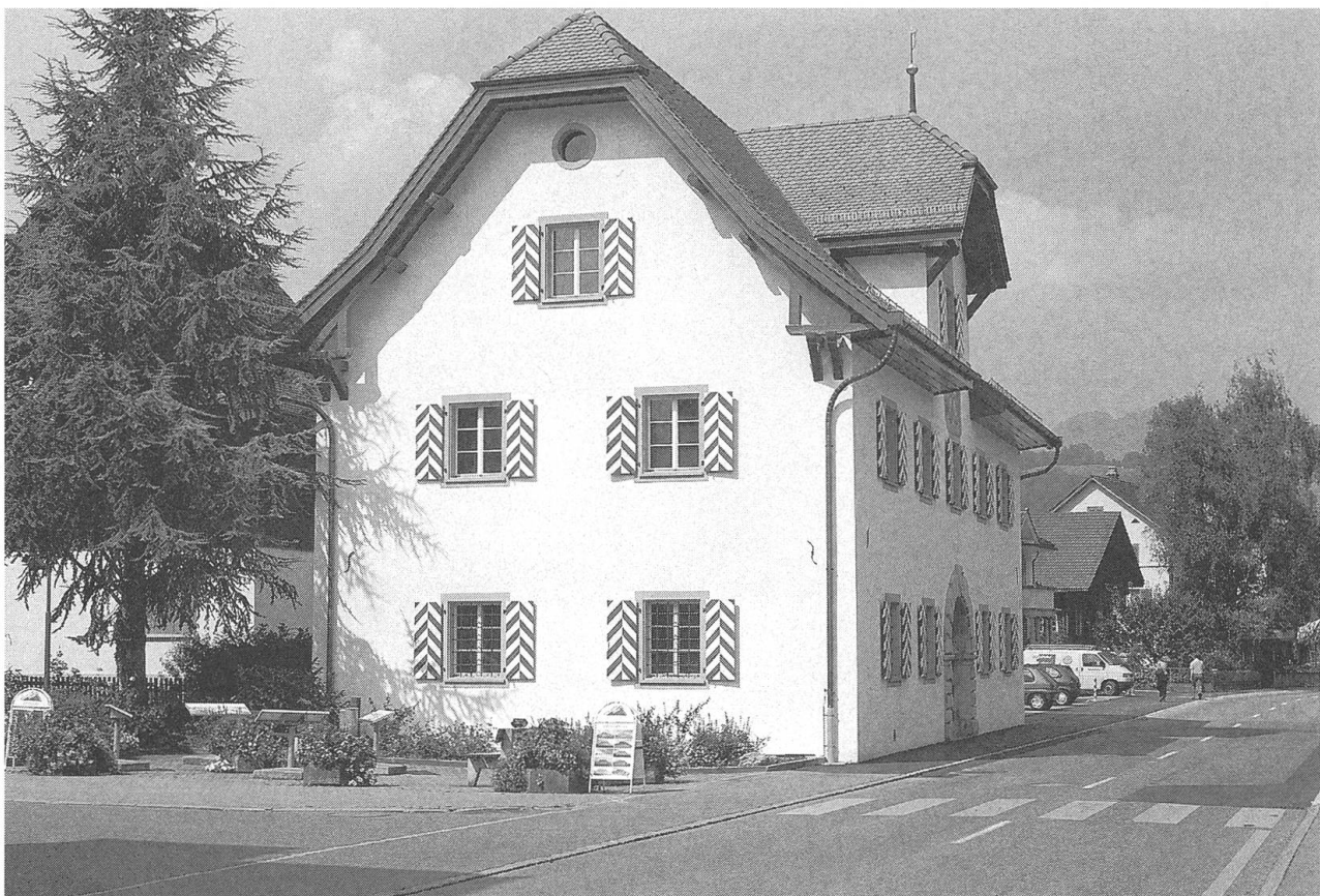
Ehemaliges Salzmagazin, heute Museum für Kunst. Aussenansicht von Nordosten.

Am 23. September 1699 beschloss der Landrat den Bau eines Salz- und Kornmagazins: Der freistehende und verputzte Steinbau wurde 1700/1701 aufgrund finanzieller Probleme und verspäteter Materiallieferungen unter Schwierigkeiten errichtet. Im Giebelfeld des nördlichen Zwerchhauses ist das Wappen des Bauherrn mit der Inschrift «HER HR NICOLAUS KEISER GEWESENER OBER-