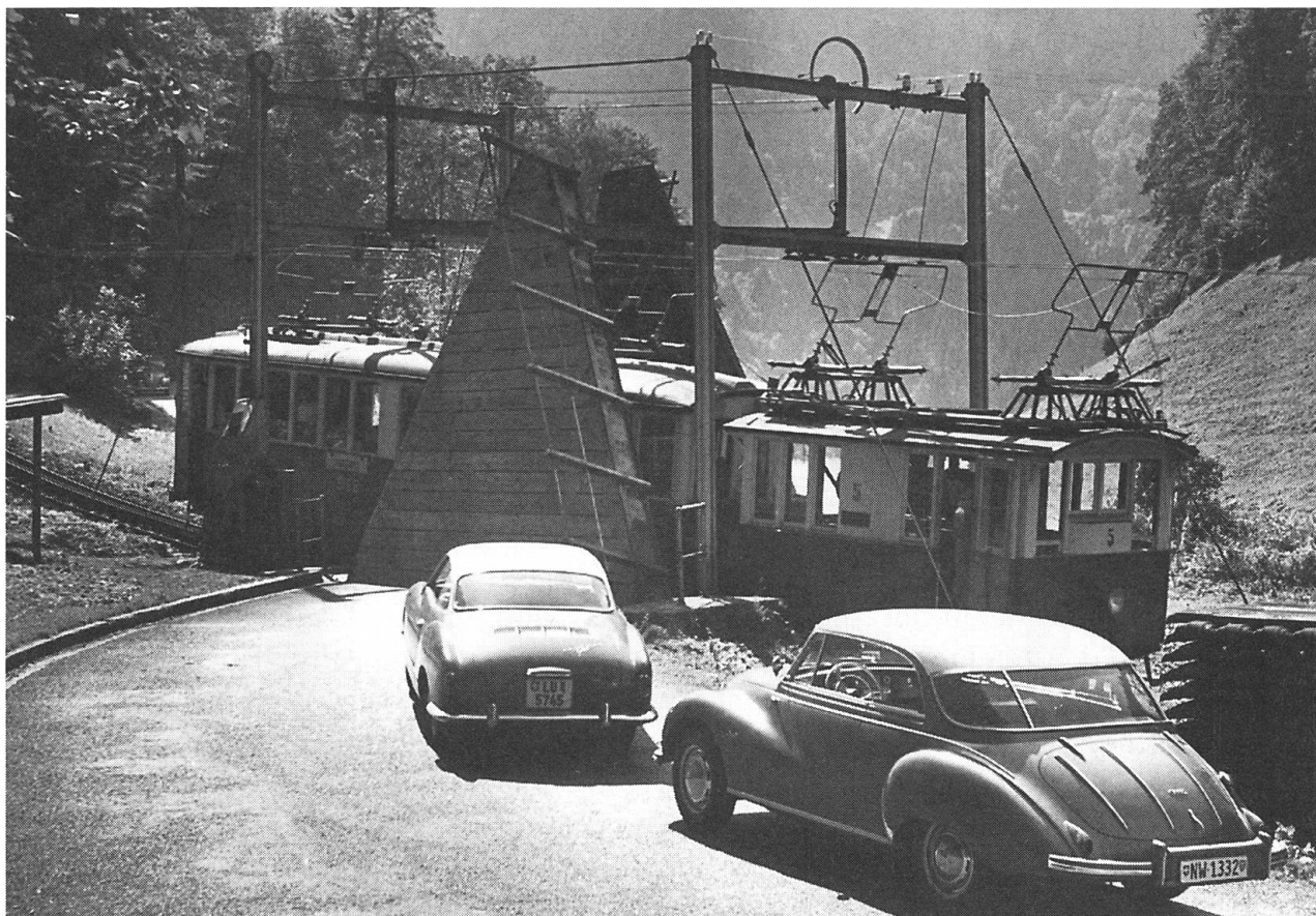
Klappbrücke in Grünenwald 1961.