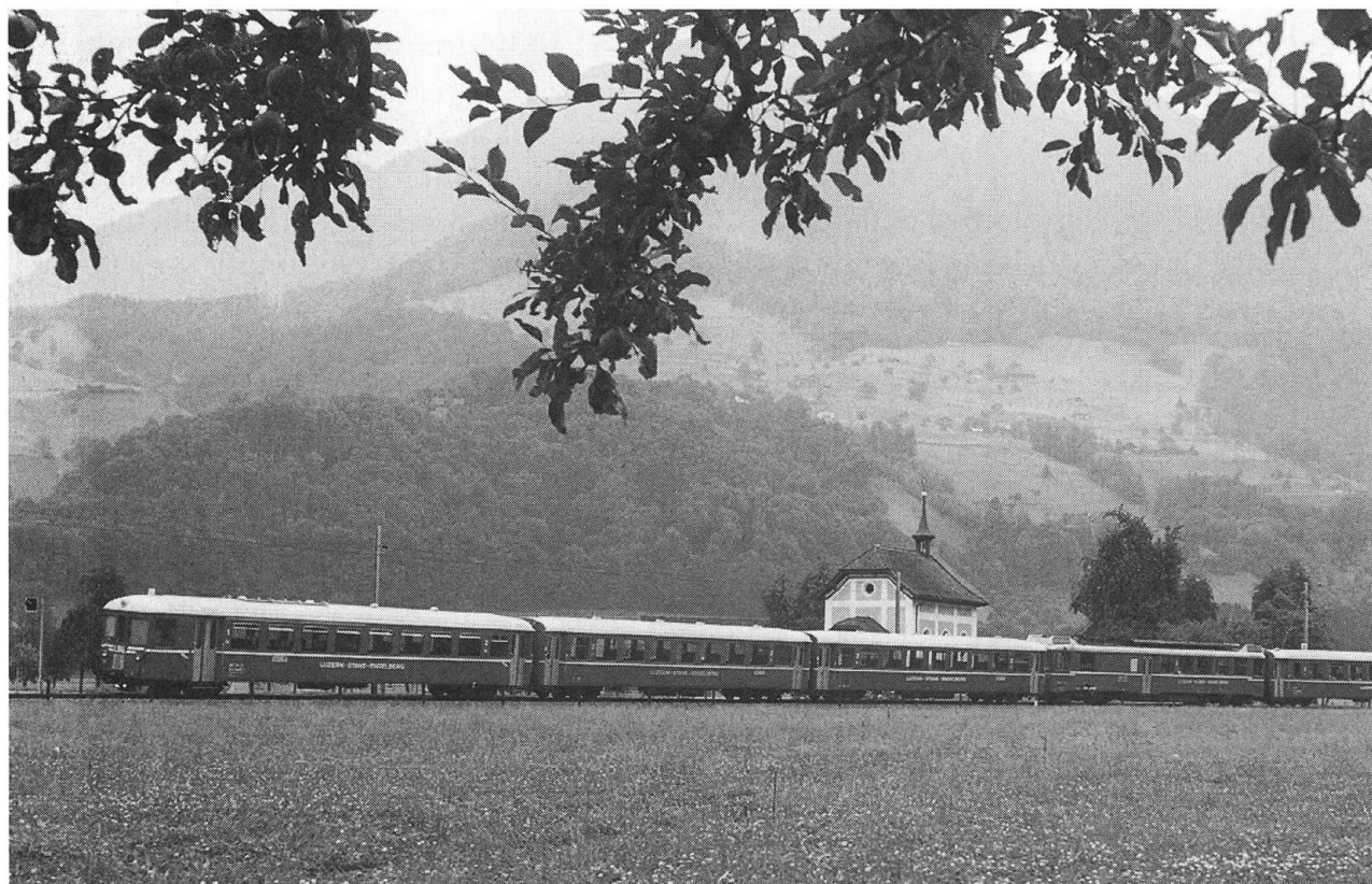
Pendel plus Wagengruppe 131 in Oberdorf bei der Rochus-Kapelle, 1995.

Auf der gesamten Strecke von rund 34 Kilometern Länge sind mit den acht modernen und komfortablen Pendelzugskompositionen jahrein jahraus Zehntausende von Einheimischen und Touristen unter-