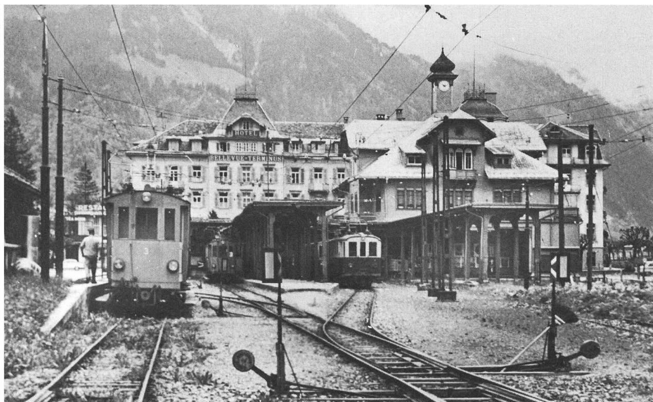
Die Endstation Engelberg, als es noch hiess «Stansstad-Engelberg-Bahn».

gewiesen, sondern man könnte sich mit den gleichen Fahrzeugen ausrüsten, wie sie auch andere Schmalspurbahnen mit gemischtem Adhäsions- und Zahnradbetrieb beschaffen. Inzwischen sind die Vorbereitungen für einen Umbau der Steilstrecke bereits sehr weit gediehen. Ob- und Nidwalden, wie auch der Bund, haben sich bereit erklärt, das Vorhaben finanziell zu tragen, und ein ausführungsfähiges Projekt liegt auf dem Tisch. Es sieht vor, die Bahn zwischen Grafenort und dem Gebiet Boden bei Engelberg in einen Tunnel zu verlegen, die Maximalsteigung wird auf 105 Promille zurückgenommen. Im Engelberger Tal macht man sich um die Zukunft der Bahn Gedanken, und dies beweist, dass auch nach hundert Jahren die Bahn ein Thema ist. Sie wird es bestimmt auch in den kommenden hundert Jahren sein.