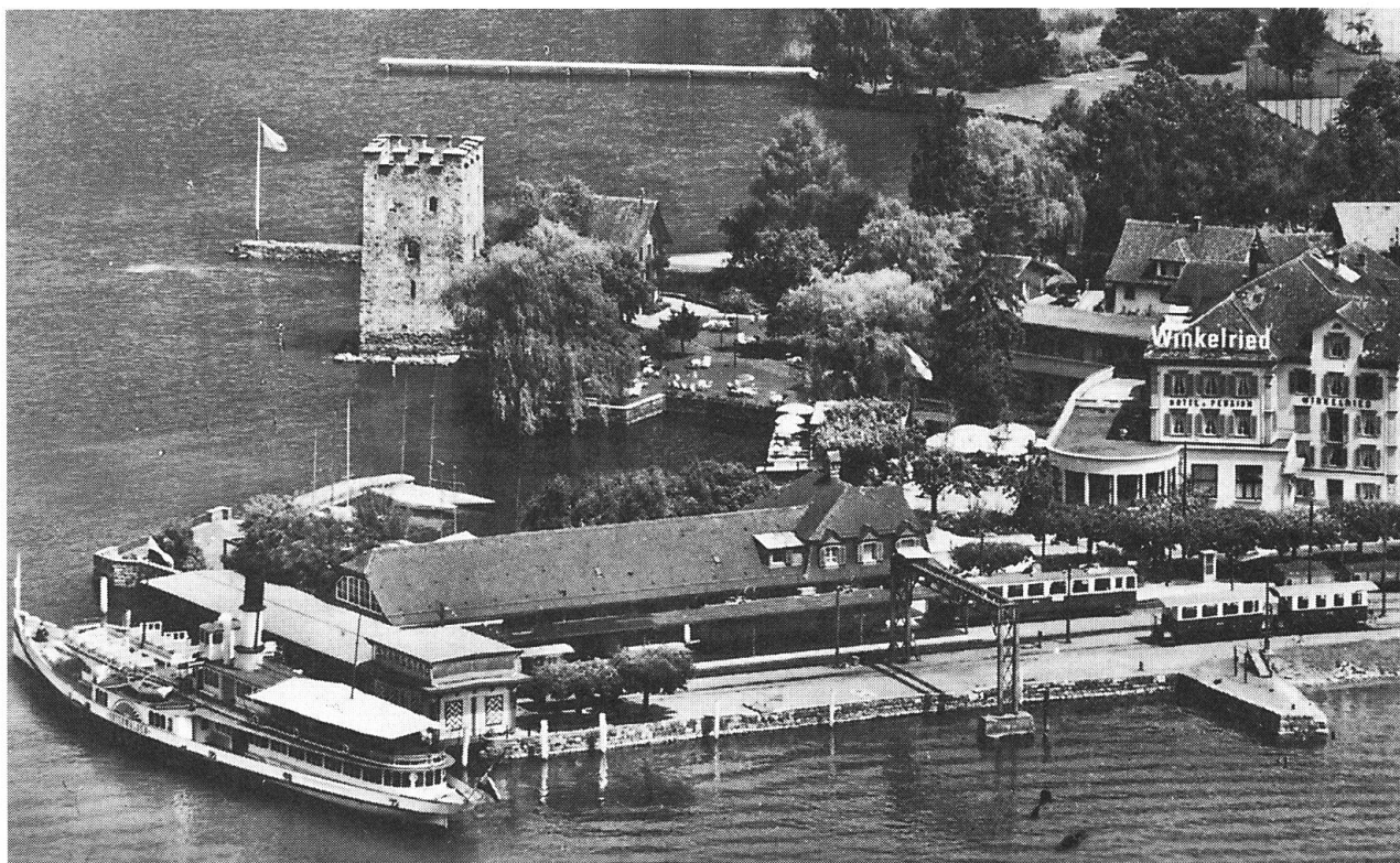
Bahnhof Stansstad mit Dampfschiff «Unterwalden» um 1940.

1837 begann auf dem Vierwaldstättersee das Zeitalter der Dampfschiffahrt. Der fahrplanmässige Verkehr zwischen Stansstad und Luzern wurde ab 1856 im Sommer und ab 1860 ganzjährig aufgenommen. 1859 wurde mit der Acheregg-Drehbrücke auch die letzte Lücke in der durchgehend befahrbaren Landverbindung nach Luzern geschlossen. Mit der Fertigstellung einer fahrbaren Strasse im Jahre 1874 verkehrten die Postkutschen bis Engelberg. Inzwischen hat-