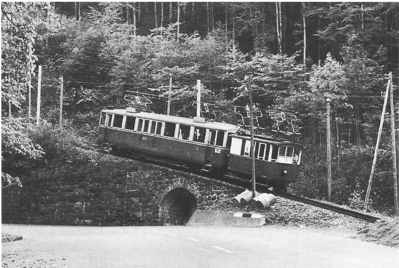
Lok WG 2/2 Nr. 3 und Triebwagen ABF 3/4 Nr. 9 beim Strassenkehr, ca. 1960.

Innerhalb der Bahnlandschaft Schweiz nahm die Stansstad-Engelberg-Bahn infolge verschiedener Besonderheiten eine Sonderstellung ein. Bereits erwähnt ist der Schiebebetrieb, der durch die starke Steigung notwendig wurde. Keine andere