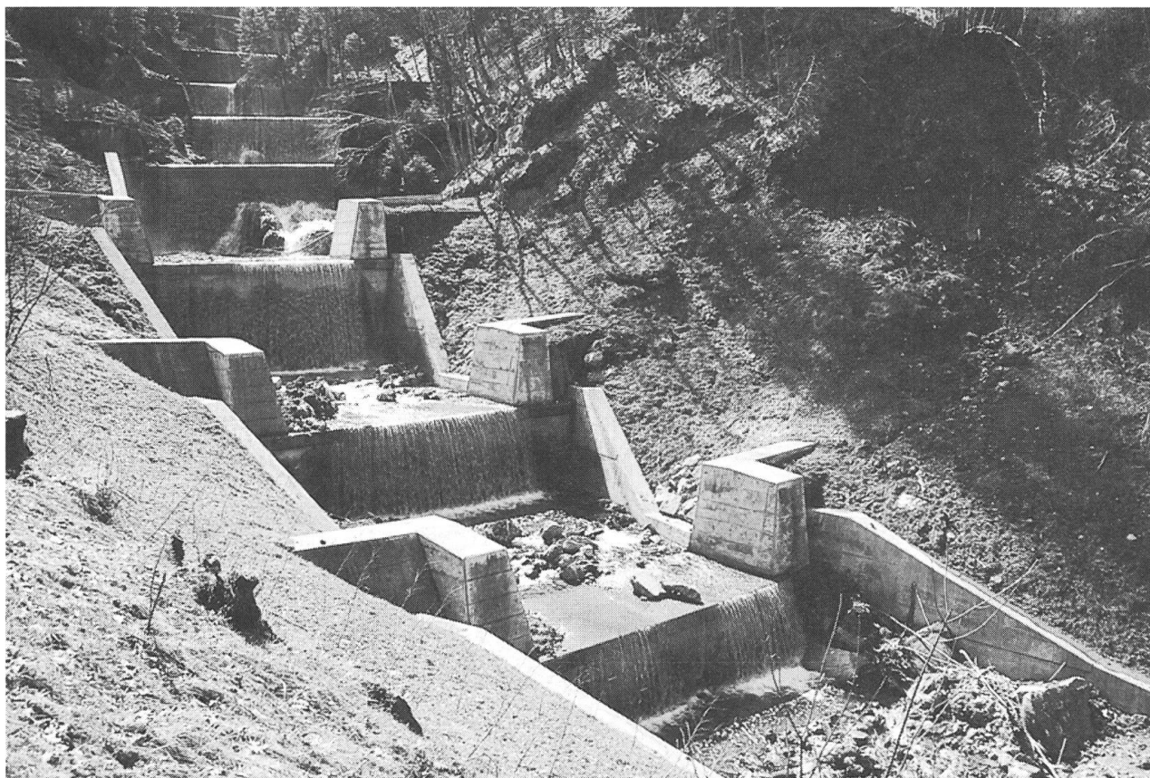
Der Lielibach wurde, soweit das irgendwie möglich ist, durch kluge Verbauungen, die auf langer Erfahrung beruht, gezähmt.