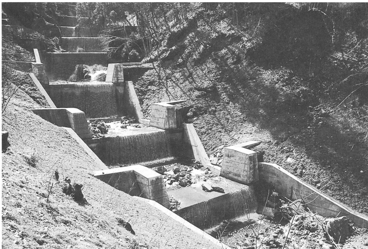
Der Lielibach wurde, soweit das irgendwie möglich ist, durch kluge Verbauungen, die auf langer Erfahrung beruht, gezähmt.