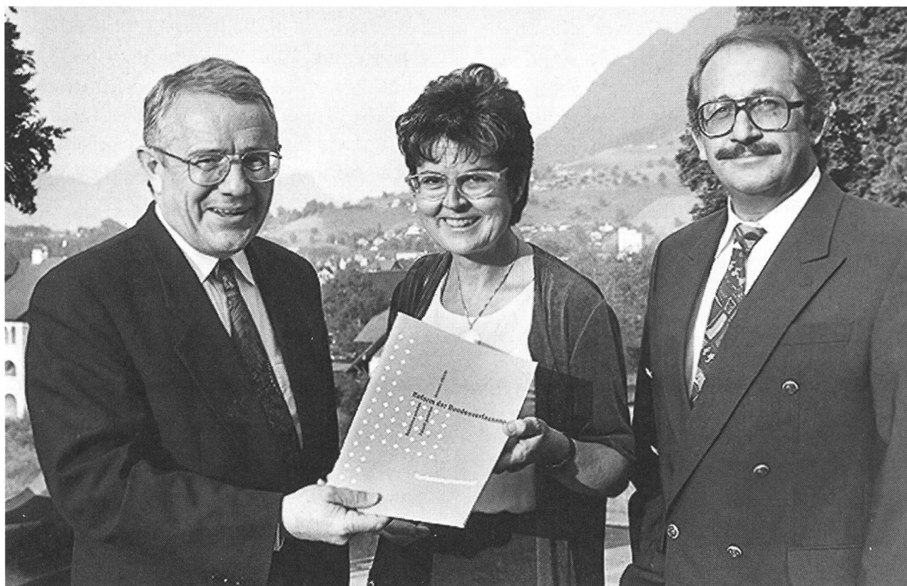
Bundesrat Arnold Koller überreicht der Nationalratskandidatin den Vorschlag zur neuen Bundesverfassung im Beisein unseres langjährigen gewiegtten Nationalrates Joseph Iten.

Ich wünsche mir, dass sich künftig noch stärker die Möglichkeit aufzeigen wird, die Ausgewogenheit der Geschlechter innerhalb der verschiedenen kommunalen, kantonalen und eidgenössischen Gremien zu verwirklichen. Es ist dies