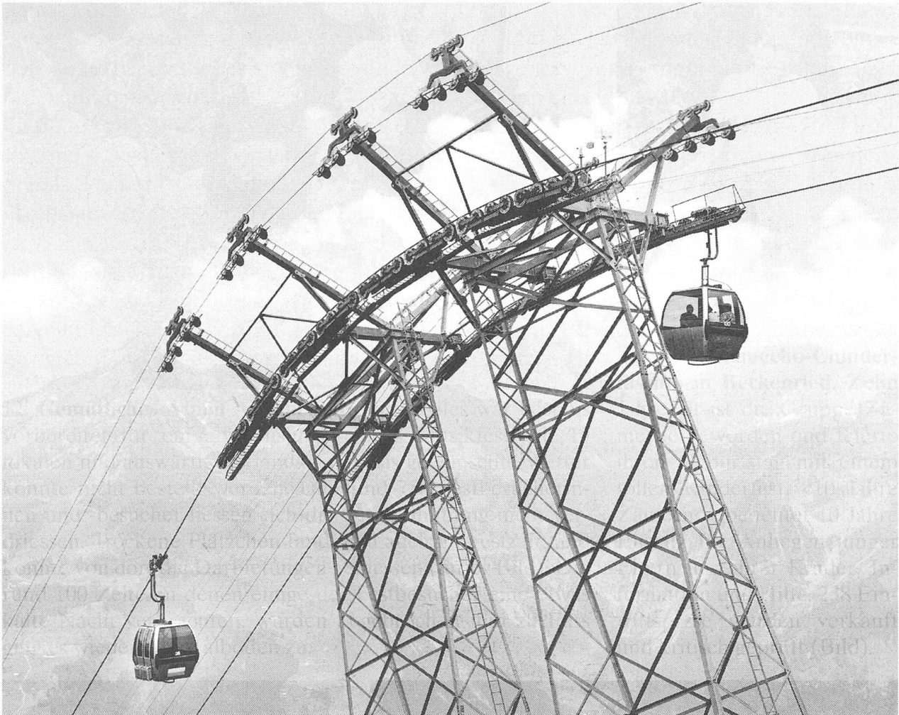
Die Schönheit der Technik in den Himmel schreiben, könnte man von diesem Pfeiler der Gondelbahn Engelberg–Trübsee sagen.

ben», knurrte Paul. Katharina lachte: «So ein heiliger Held zu sein, getraust du dich wohl nicht? Überlege es dir noch einmal. Im Dorf würdest du bewundert. Jetzt lachen alle Leute über euren alten, viel zu alten Streit.»