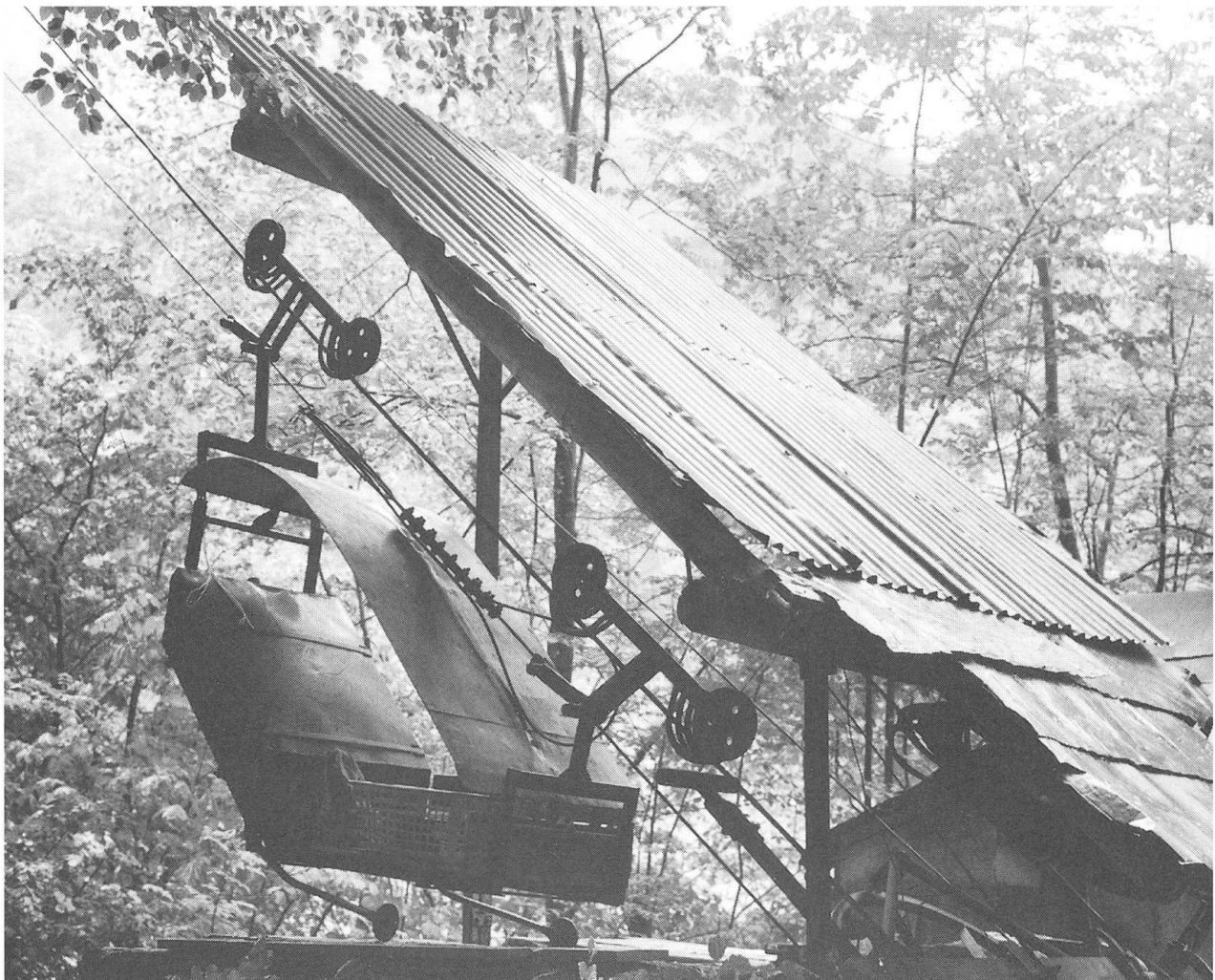
Noch heute führt in den Zingel die steilste, wassergetriebene Luftseilbahn.