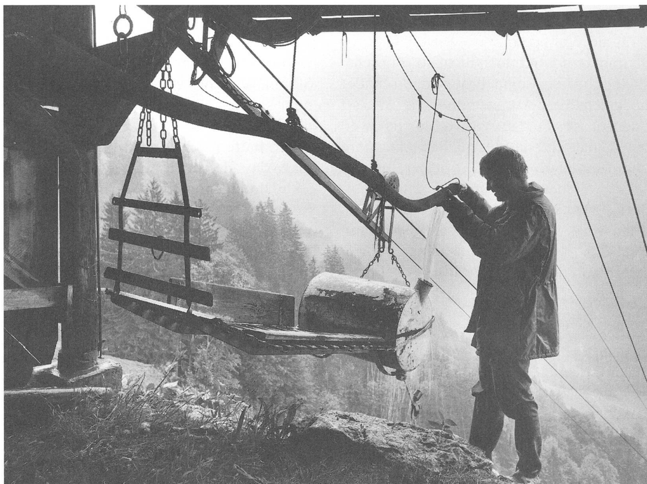
So wird in der Brändlen Wasser eingefüllt, damit das obere Bähnchen das untere Bähnchen hinaufzieht.

Plötzlich «rupfte» das Auto, fuhr stotternd weiter. Dann stellte der Motor total ab. Das Auto stand still. Das hatte ihm gerade noch gefehlt. Weit und breit keine Garage. Er machte die Motorhaube auf. Konsterniert und ratlos schaute er in das Gewirr der Kabel und Hebelchen. Was sollte er da. Er war ausgebildeter Landwirt mit Abschluss, aber kein Automechaniker. Gewiss, in der Landwirtschaftsschule hatte man ihnen auch die Funktion eines Motors erklärt, aber ein einfacher Traktorenmotor und dieses ineinanderge-