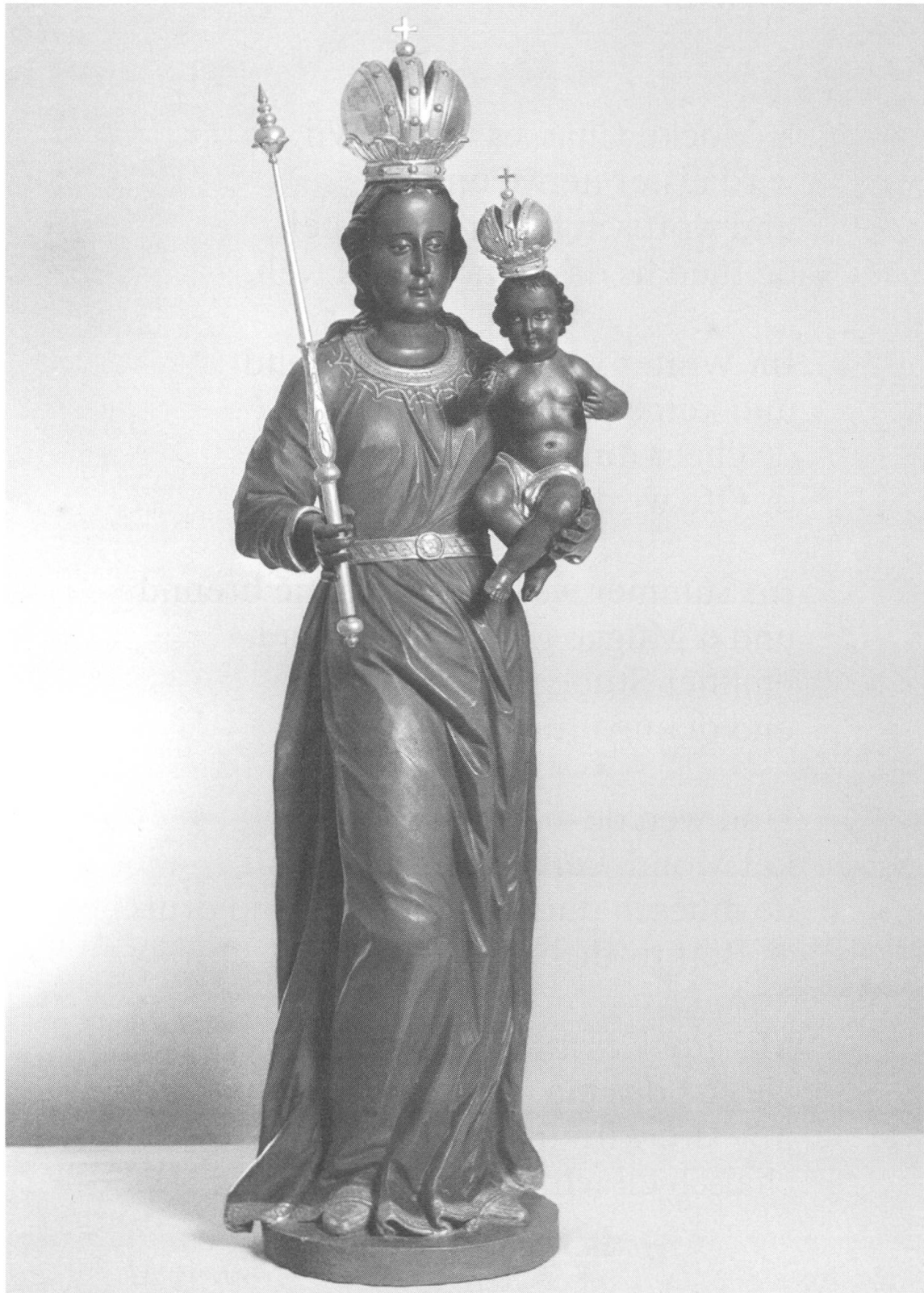
Kopie des Einsiedler Gnadenbildes von J. B. Babel um 1790 im Benediktinerinnen-Kloster Glattburg, Oberbüren SG.