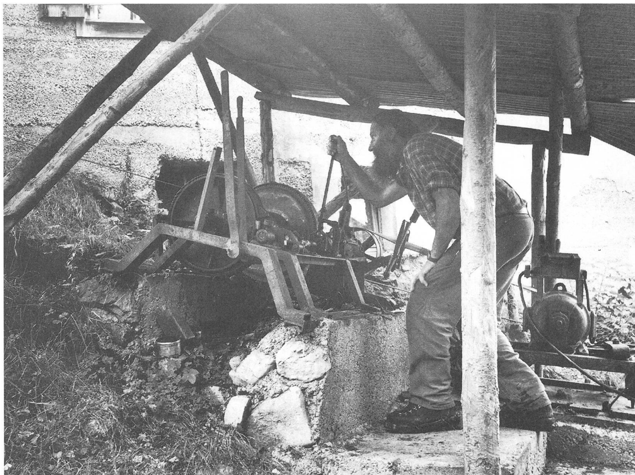
Das dritte und oberste «Grunggis-Seil», das von Hütti noch weiter hinaufführt. Selten sieht man Motor, Transportrad und Bremse so übersichtlich wie hier.