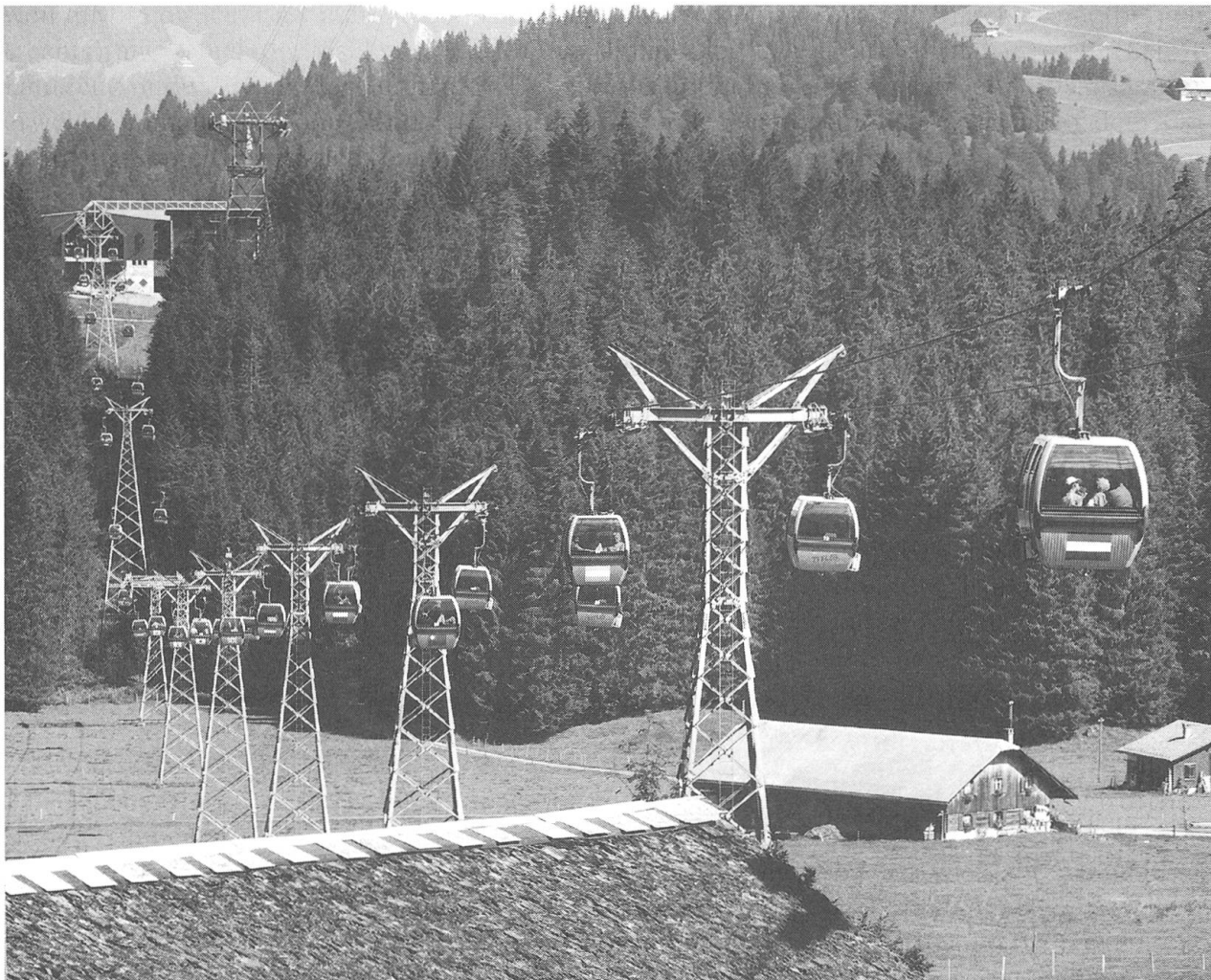
Wie Hagpfosten stehen die Gondelbahnstützen im Alpboden Untertrübsee.

kel», lachte diese. – Aber, wenn es nicht indiskret ist, warum geben sie dann keine Schule», fragte Frau Burri. «Wegen dem Kind», meinte Katharina schmunzelnd. «Haben sie denn ein Kind», fragte diese? «Ich nicht, aber wir waren zwei Lehrerinnen. Ich bin ledig, und meine Kollegin, als alleinerziehende Mutter, war auf die Stelle sehr angewiesen. So zog ich mich aus dem Schuldienst zurück, als die Stellen reduziert wurden. «Das ist grosszügig», sagte Frau Burri. «Darf ich ihnen das <Du> anbieten, mein Name ist Hildegard.» «Und meiner Katharina.» Du kannst berichten, wenn es nötig ist, es macht mir Spass, wieder Schule zu geben.