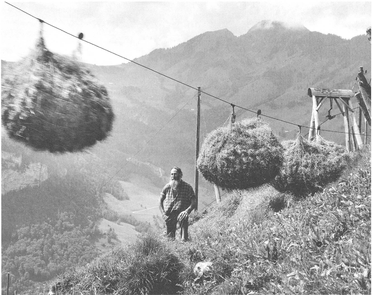
Mit solchen Heu-Transportseilen, wie in Hütli, hat die Seilbahntechnik in Nidwalden begonnen. Das erste, das aus zusammengeschweissten Stangen besteht, existiert noch heute.

Sehnsucht nach deinem Vaterhaus hast, warten dir hier schöne Aufgaben als Grossmutter auf dich.»