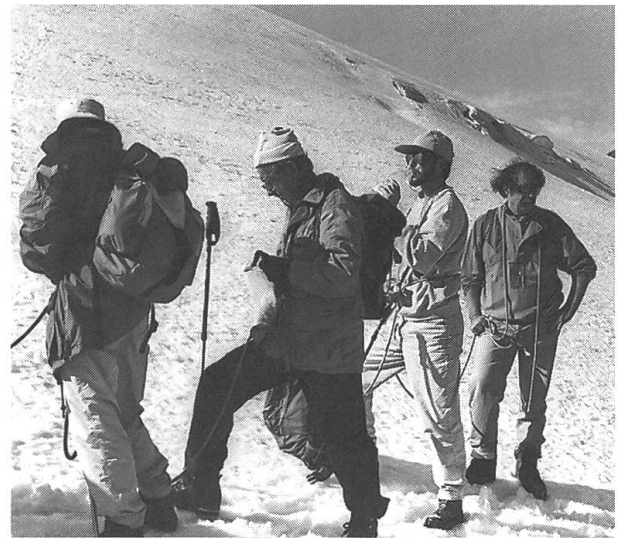
Letzte Rast vor dem Gipfelsturm

«Gratuliere, super...» Alle waren sich auf dem Titlisgipfel an diesem Samstag vormittag einig: Das frühe Aufstehen hatte sich gelohnt. Es war eine herrliche Sache, und auch wenn ein leichter Dunstschleier die Aussicht ein wenig trübte, man genoss sichtlich das impo-