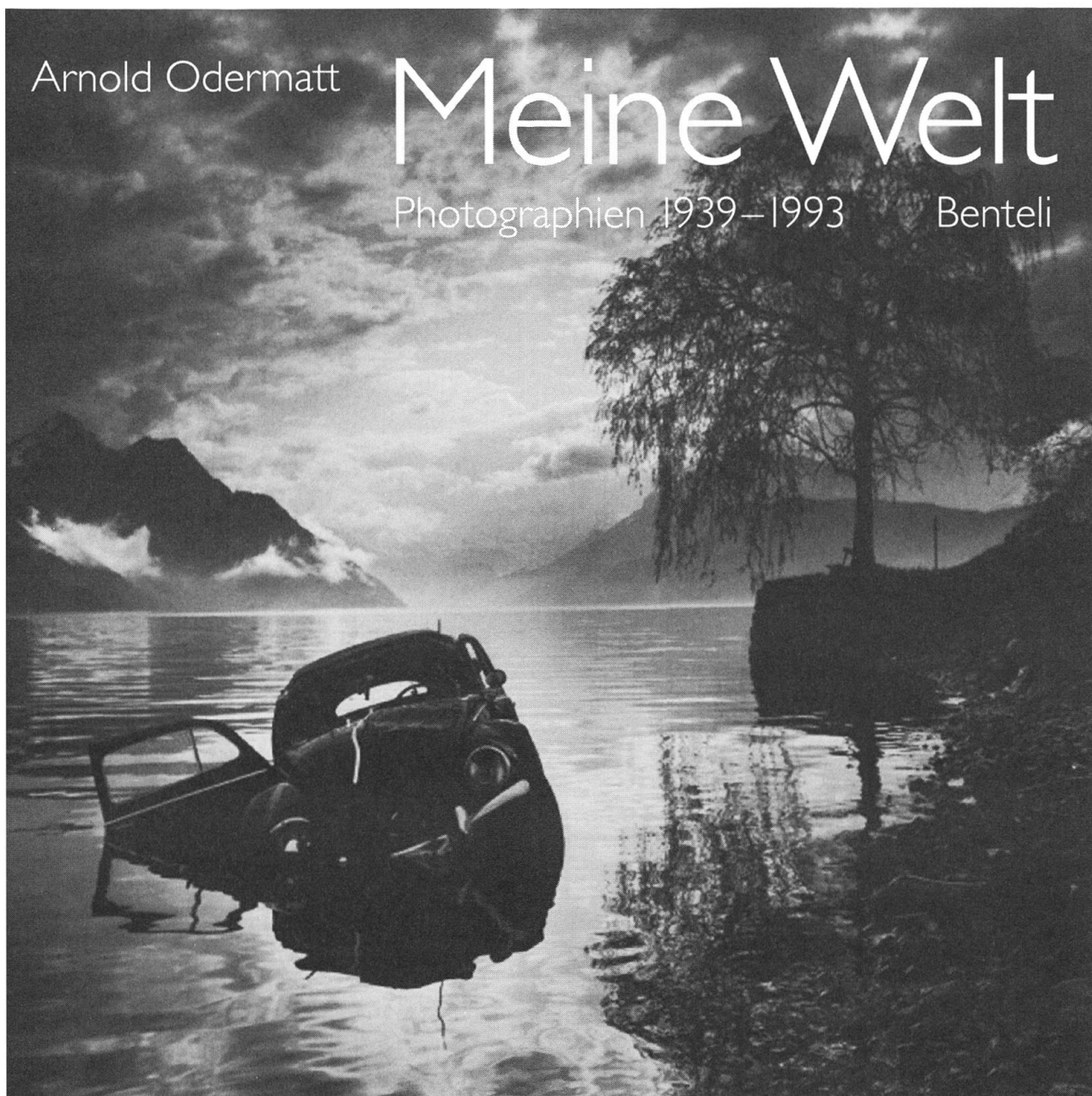
A. Odermatt, Meine Welt , 30 x 29,5 cm, 26 Farb- und 116 Duplexabbildungen, gebunden, Fr. 85.–

«Meine Welt» von Arnold Odermatt ist ein Querschnitt durch seine Arbeiten in den Jahren 1939–1993. Wir kennen den sorgfältigen Fotografen, der sich so minutiös um die Details kümmert, an seinen Fotos aus der «Nidwaldner Zeitung» und aus seinem Buch «Nidwalden im Bild». Von einem so hervorstechenden Fotografen wurden noch nie Unfallbilder gezeigt. Diese Besonderheit bei Arnold Odermatt zeigt, dass seine Aufnahmen zwar ganz exakt zeigen, was sein muss, aber immer auch auf Einzelheiten aufmerksam machen, die sonst niemand sieht. Der Nidwaldner Arnold Odermatt ist im Bad in Oberdorf geboren, kam in der Welt herum und wurde bei der Polizei in seinem Heimatkanton Nidwalden Chef der Verkehrspolizei und Vizekommandant. Wir sind stolz, wenn solche Könnner aus unserer Heimat hervorgehen.