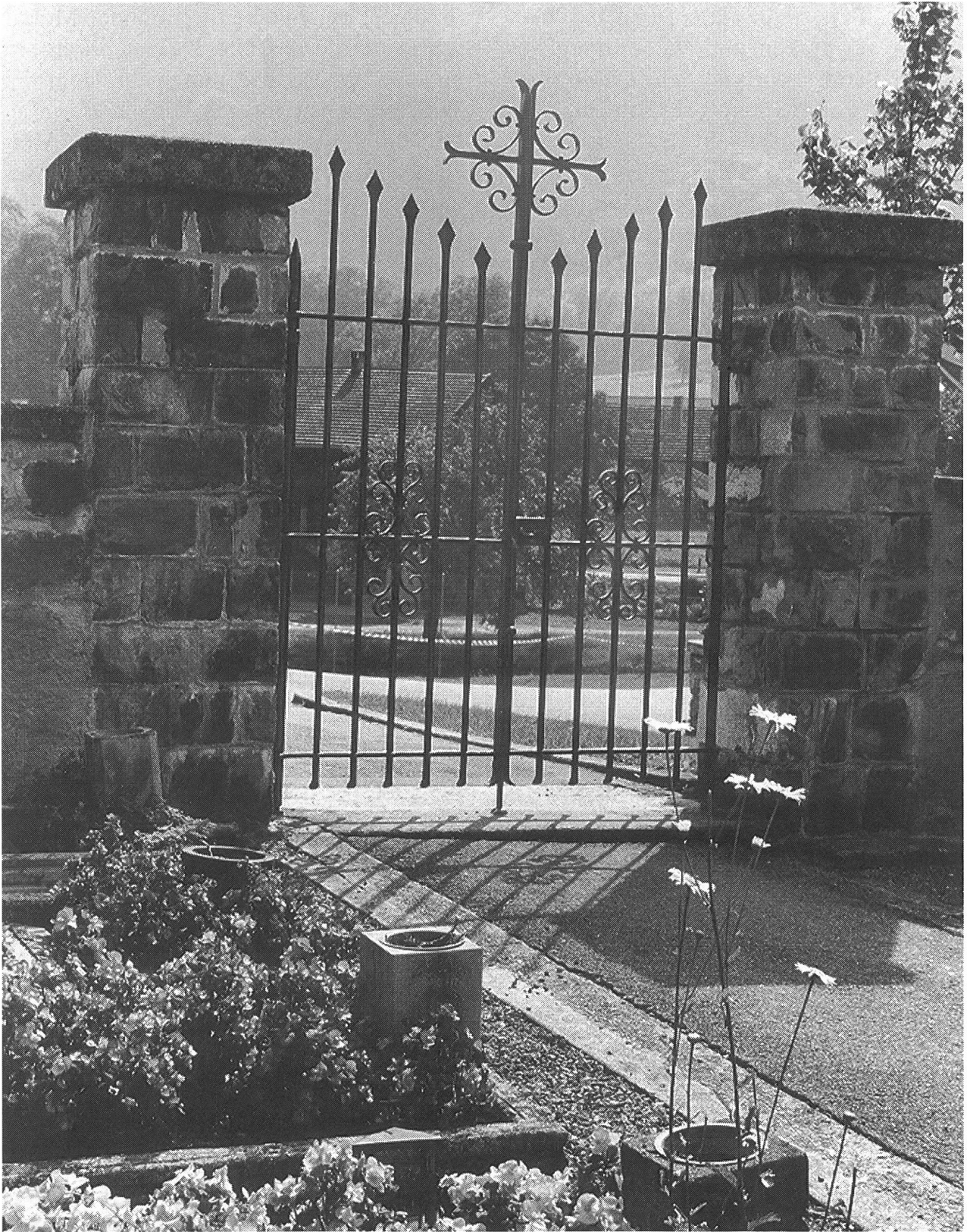
Friedhoftor in St. Jakob (Ennetmoos). Die mit einfachen Formen gestaltete Arbeit will mit dem dominierenden Kreuz auf den Ort der stillen Begegnung, aber auch auf die christliche Hoffnung hinweisen. (Entwurf und Ausführung: Gebr. Leuthold, Stans)