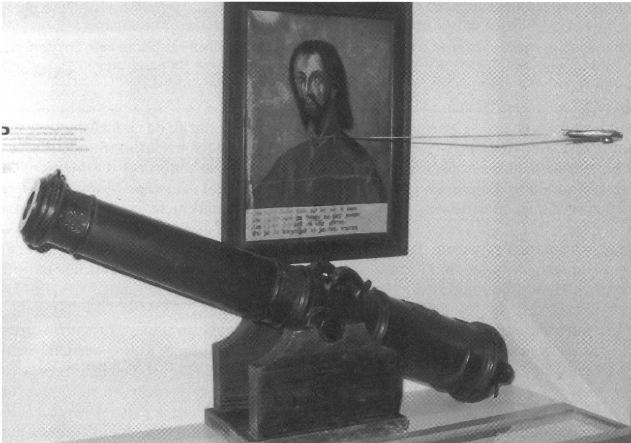
Höfli: Der «Überfall» 1798; Relikte des Krieges. Die Nidwaldner Zweipfünder-Kanone wurde von den Franzosen erbeutet und das gegossene Nidwaldner Wappen durch Beilhiebe unkenntlich geschlagen. Das Bild des Bruder Klaus hing der Überlieferung nach in einem der Bünt-Höfe zwischen Wil und Stans und wurde durch französische Truppen im Sinne einer symbolischen Exekution eines verhassten Vertreters des christlichen Glaubens durch Säbelhiebe beschädigt.

Bereits im Mittelalter wurde in Stansstad eine Landesbefestigung mit dreifachem Pallisadengürtel im See, mit Schnitzturm, Letziturm und einem umfangreichen Wallgrabensystem errichtet, um die Einfallachse nach Nidwalden zu sperren. Zuletzt hielt diese Befestigung beim Franzoseneinfall. Der französische General