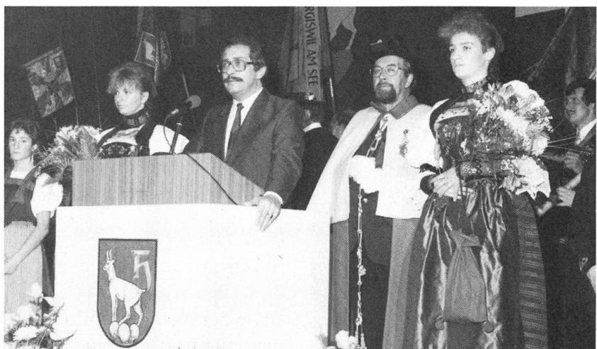
Ein Nationalratspräsident hat auch Pflichten und so musste er mehr als einmal ans Rednerpult treten.