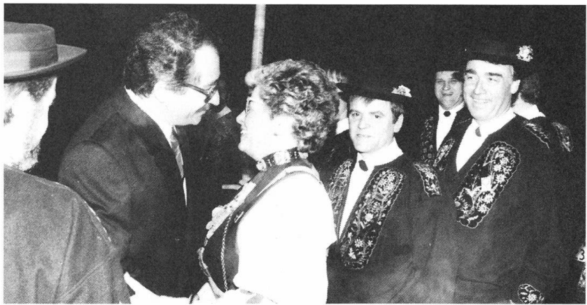
Herzlich und spontan war der Willkomm des Hergiswilers in der Gemeinde Hergiswil.

Kurz vor Mitternacht rief die Pflicht die Parlamentarier und auch den Nationalratspräsidenten wieder nach Bern, denn am anderen Morgen präsidierte Joseph Iten wieder den Nationalrat. Inzwischen ist das Präsidentenjahr schon fast vorbei, denn mit Beginn der Wintersaison Ende 1989 ist das Präsidialjahr wieder vorbei.