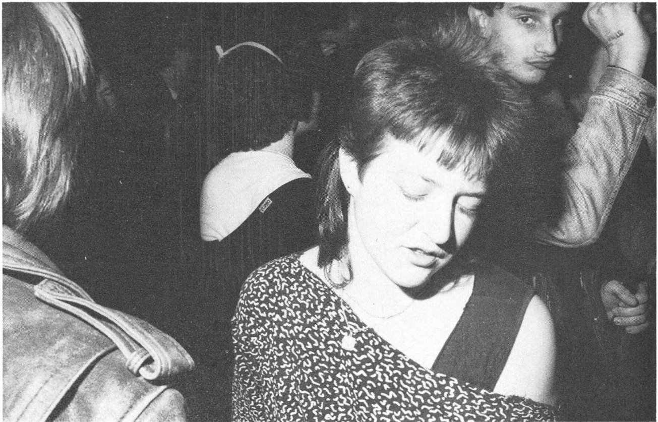
Niederrickenbach Disco, Beckenried