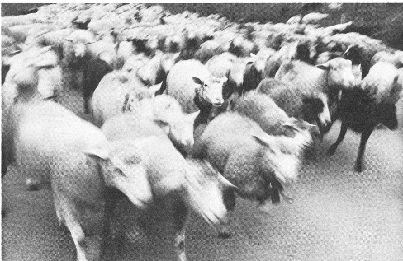
Bittgang, Buochs Alpaufzug, Oberarni