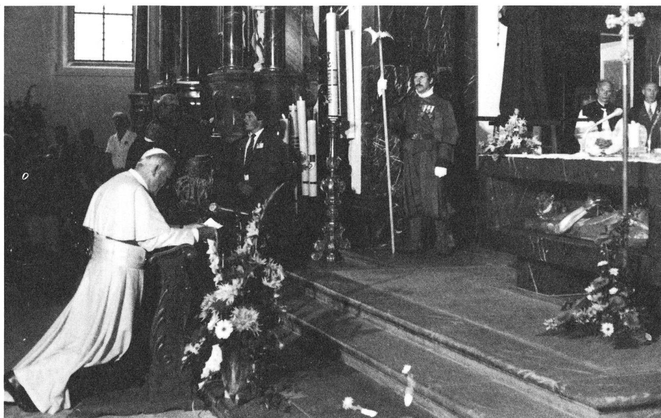
Johannes Paul der II. in der Bruderklausenkirche Sachseln, als er im Juni 1983 die Schweiz besuchte.

zuletzt im Hinblick auf die triumphale Heimkehr der Sieger von Pavia. Auch die unter Fahnen stehenden kleineren Abteilungen der zugewandten Orte und der Untertanengebiete erhielten einfachere Banner ohne Eckquartiere. Die Juliusbanner wurden stets hoch in Ehren gehalten; die meisten dieser päpstlichen Auszeichnungen haben sich bis heute erhalten. So auch in Obwalden, wo das Banner der Unterwaldner heute im Museum hängt (Nidwalden erhielt, wie bereits erwähnt, ein eigenes Banner, das im Rathaus aufbewahrt wird). Die quer rot-weiss geteilte Fahne in dem typisch mailändischen Granatapfel-Damast ist 152 cm hoch 175 cm lang. Im karmoisinroten oberen Felde ist die Figur des heiligen Petrus mit Doppelschlüssel und das Eckquartier mit der Kreuzigungsgruppe. Dieses Banner wurde früher (bis 1920) alle zehn Jahre «auf die Landsgemeinde getragen». Die später (1552 in Anlehnung an das Nidwaldner Banner) in lateinischer Sprache abgefasste, auf der Seite umlaufend gemalte goldene Inschrift lautet in deutscher Übersetzung: «Im Jahre 388 nach Christi Geburt hat das Volk von Unterwalden ob dem Wald unter Papst Anastasius für den christlichen Glauben in der Stadt Rom glücklich ge-