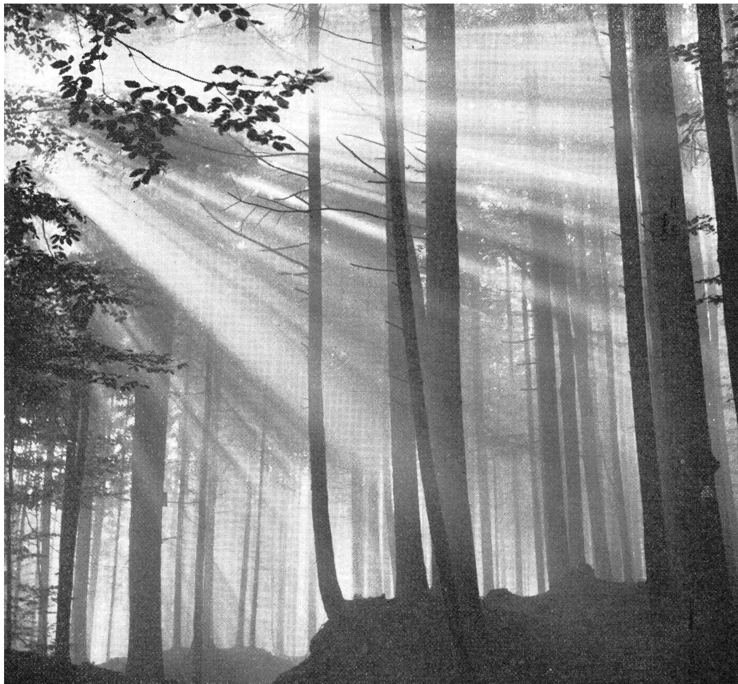
Die Strahlen der letzten Sonne im Herbstwald.