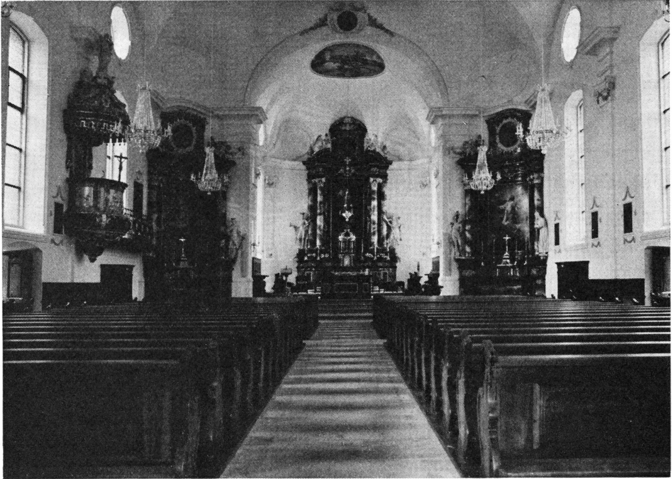
Der überraschend weite und lichte Innenraum.