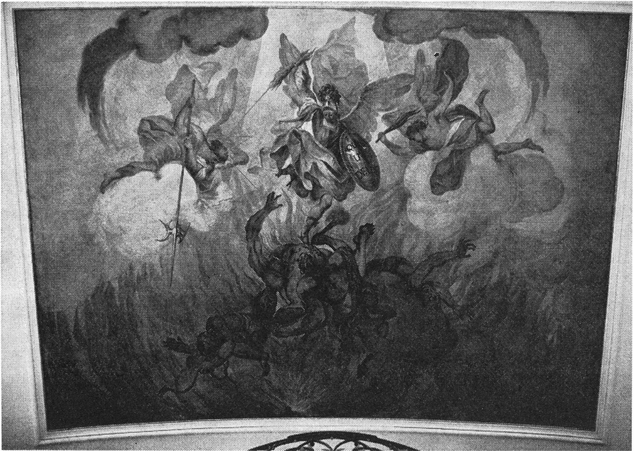
Unter dem süßlichen Engeltriumph kam auf der Originalschicht ein handfester Höllenssturz der Verdammten zum Vorschein.

che auffallend, die Darstellung dessen, was folgt, wenn man nicht in den Himmel kommen kann oder ihn nicht erstrebt: ein aussagekräftiger Höllenssturz. Gerade dieses letzte Bild war die Entdeckung während der Restauration, weil es von Deschanden mit einem lieblicheren Hinweis auf das Jüngste Gericht übermalt war (während die andern Deckenbilder zum grössern Teil mit kräftigeren Farben nachgemalt waren).