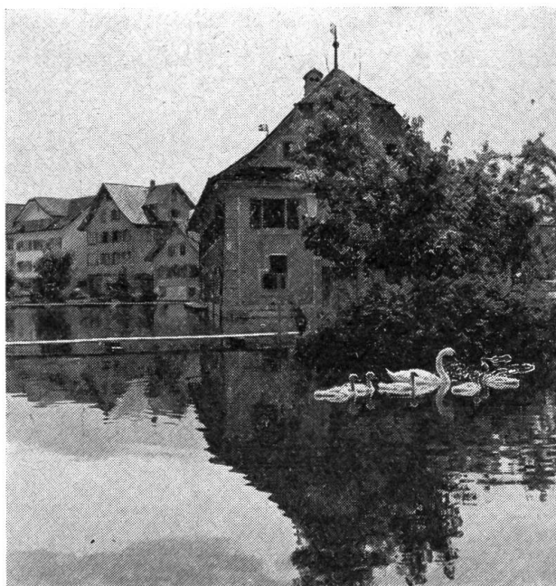
1970 tummelten sich die Schwäne auf dem Dorfplatz Stansstad. Die Sust wurde stark in Mitleidschaft gezogen durch das Wasser, das in die Mauern eindrang.

Wenn heute das Gebäude etwelche Spuren seines Alters erkennen läßt und durch spätere, wenig angemessene Eingriffe archi-