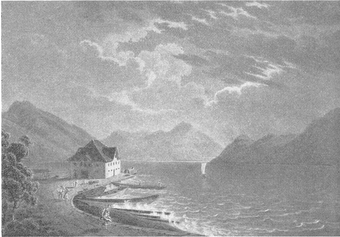
Die Sust in Alpnach

Nach einem kolorierten Stich von J. J. Wetzel aus dem Jahre 1820