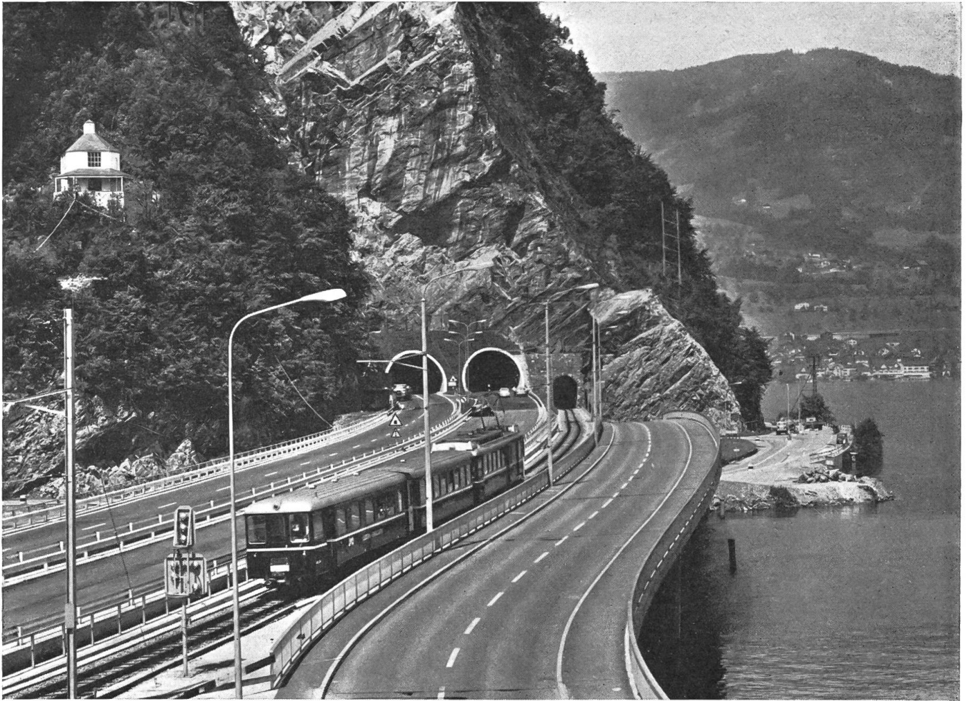
Hier am Lopper, am Tor zu Nidwalden drängt sich Bahn, Autobahn und Lokalstraße zusammen.