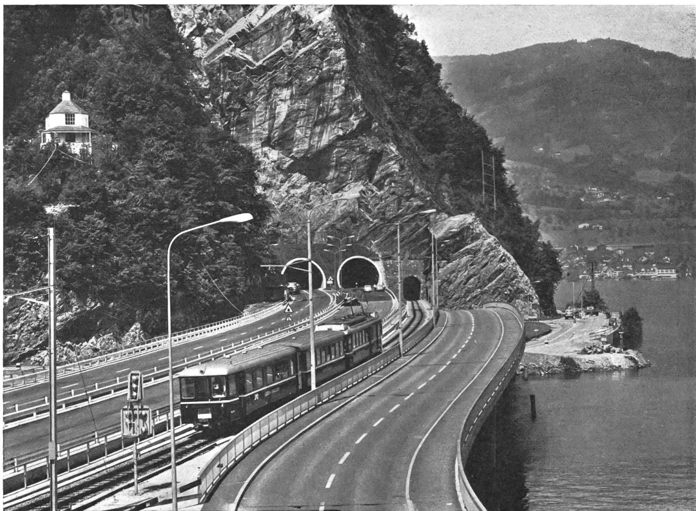
Hier am Lopper, am Tor zu Nidwalden drängt sich Bahn, Autobahn und Lokalstraße zusammen.