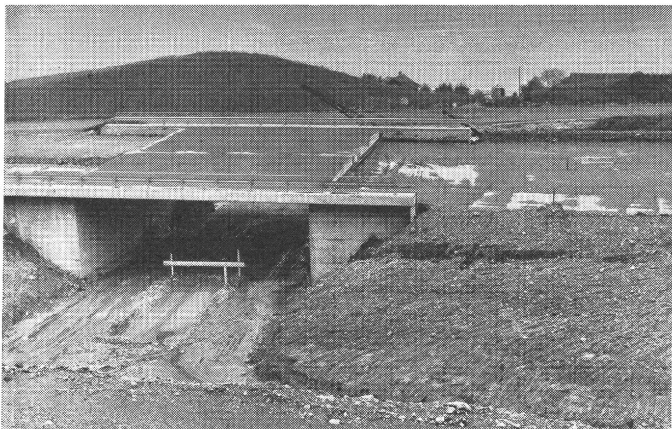
Das Anschlußwerk Hobiel dient Buochs und Beckenried.