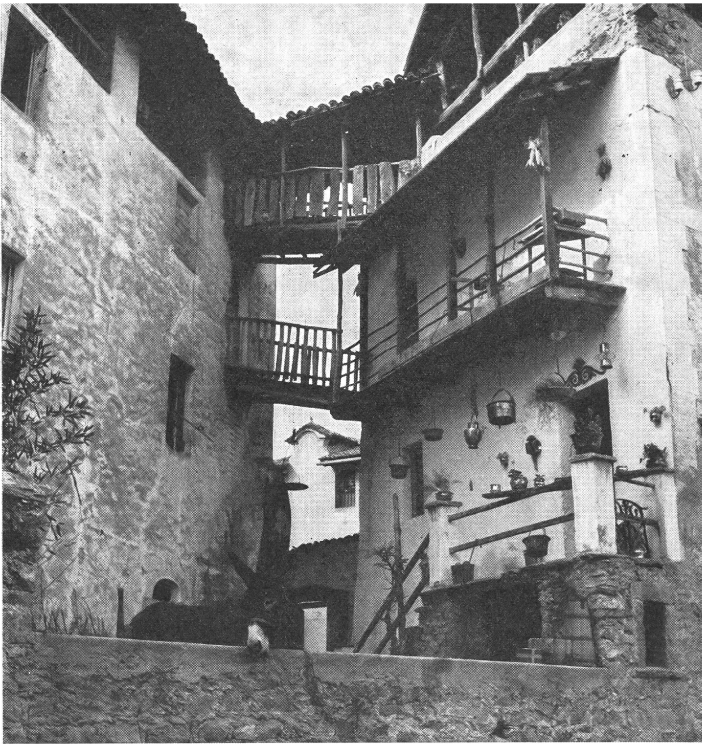
In Carona wird so gute Nachbarschaft gehalten, daß von Haus zu Haus Brücken geschlagen werden.

ter wurde ihm das Mißfallen der gnädigen Obern kundgetan, weil er öffentliche Tänze besuche und sogar selber tanze. Wörtlich heißt es: «Unsere Obern seye ihm nid widrig, daß er, wenn er Geschäften halber durch das Land geben müsse, er wohl ein Schoppen wein und etwas speis in einem Wirtshaus nehmen kenne, doch an einem besondern Tisch und nicht bey andern