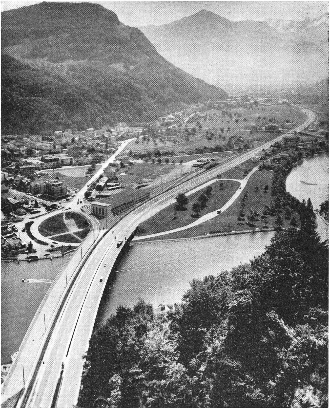
Die Autobahn von der Acheregg bis zur Kreuzstraße wurde am 22. Dezember 1967 fröhlich, feierlich und mit einem Pilatus-Porter eingeweiht. Seither sind die berüchtigten Autoschlangen bei der Acheregg und in den Dörfern verschwunden. Zwischen Luzern und Engelberg muß nur noch Wolfenschießen durchfahren werden. — Aus der neuen Ausgabe von Konstantin Vokinger, Nidwalden Land und Leute.