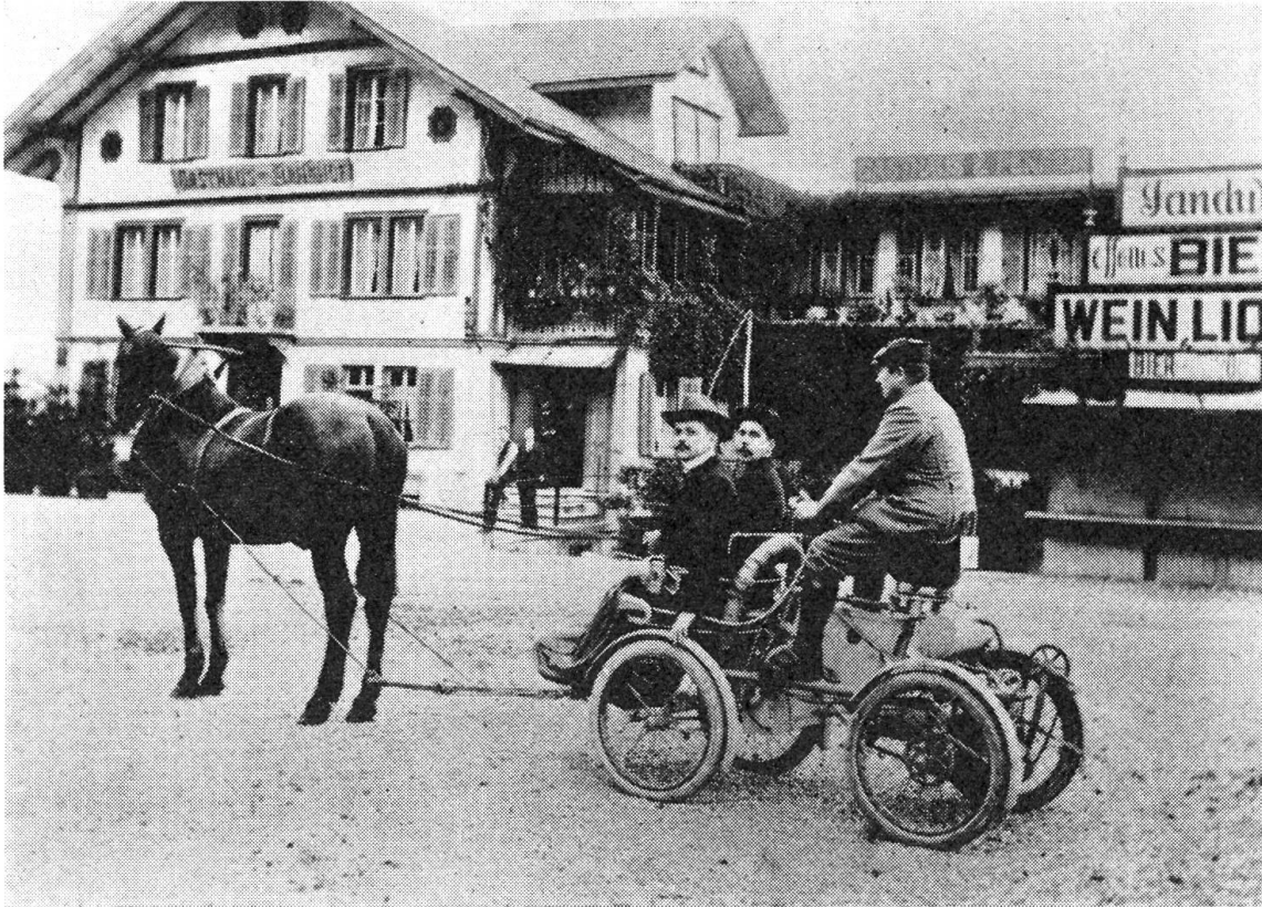
Kontrollstelle für die Automobilisten beim Bahnhof in Giswil. Dem Motowagen ist bereits ein Pferd vorgespannt, um dem Gesetz zu genügen.

nerischen Brünigroute“ in die Hand gedrückt. Langsam sei er nun den Paß hinaufgefahren. In Lungern habe ihn ein Polizist angehalten und ihm gesagt, er sei zu schnell gefahren. Er dürfe nicht weiter fahren, müsse den Polizeidirektor von Sarnen erwarten, der in zwei Stunden ankomme, um ihm eine Strafe wegen Überschreiten der erlaubten Maximal-Fahrtgeschwindigkeit aufzubrummen. Und weil der Brünig für Automobile nur bis 4 Uhr nachmittags offen sei, müsse er zur Fortsetzung der Reise Pferde vorspannen.