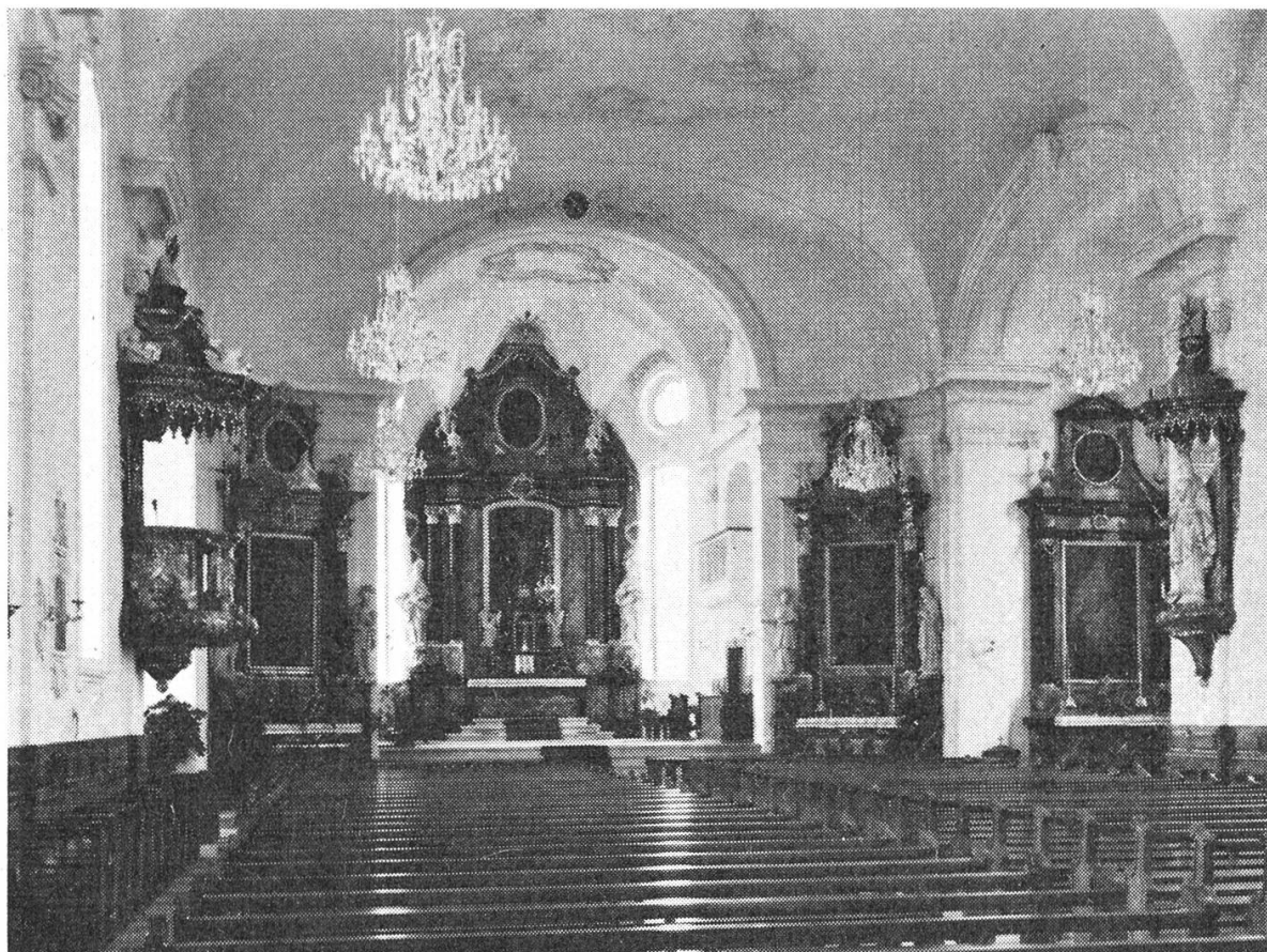
Inneres der neuen Pfarrkirche von Buochs