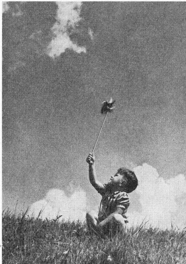
Meirädli mit Windrädli

Er gibt sich einen Ruck und läutet. Das Gartentor summt und schwenkt auf. — Nun steht er vor dem schönen Portal. Hinter dem Schmiedeeisengitter öffnet sich ein kleines Fenster, eine schnippische Stimme und ein hochnäsiges