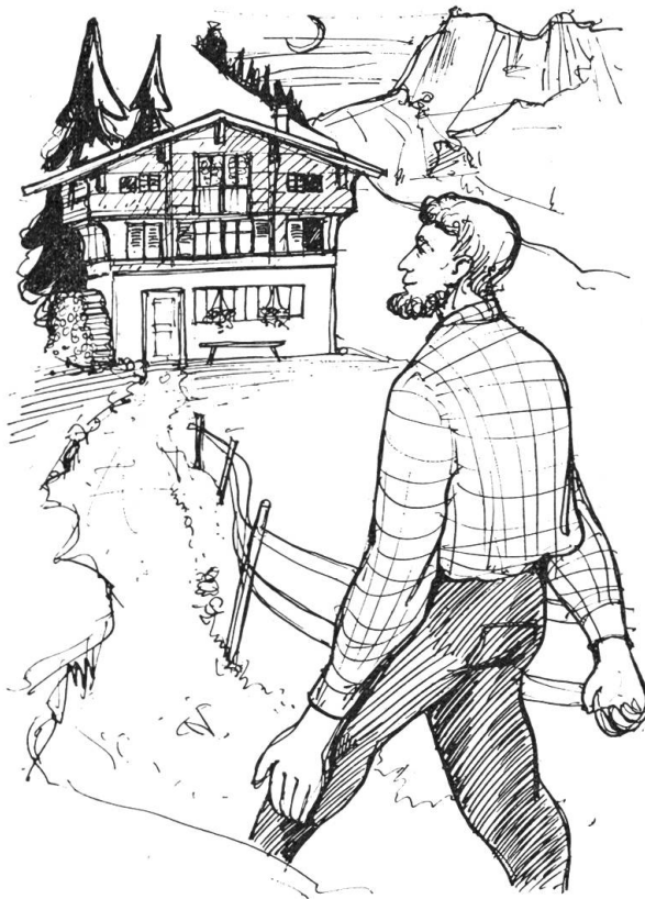
Bärli hatte sich einen dicken Knebelbart wachsen lassen und suchte im Schwandbödli Quartier

Ohne sich auch nur einen Zentimeter zu bewegen, bleibt er in dieser unbequemen Lage, bis Regi wieder da ist. „Aufsitzen“, kommandiert das Mädchen und hält ihm den Spiegel vor. „Fein gemacht? Ja oder nein?“ „Großartig, wunderbar“, rühmt er,