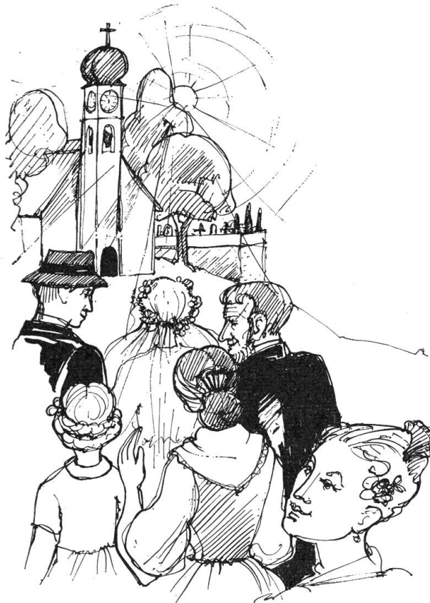
Ein kleiner Hochzeitszug, von Sonnenstrahlen übergoßen

So war es auch. Regi mußte nicht immer wieder ein altes Unrecht verwürgen. Froh und unerschrocken begegnete die junge Frau dem alten Schnauzi. Nahm ihm die bösen Worte aus dem Munde und gab ihnen einen guten Sinn. Sie half ihm auch bei seinen Schreibarbeiten, rüstete ihn aus, wenn er