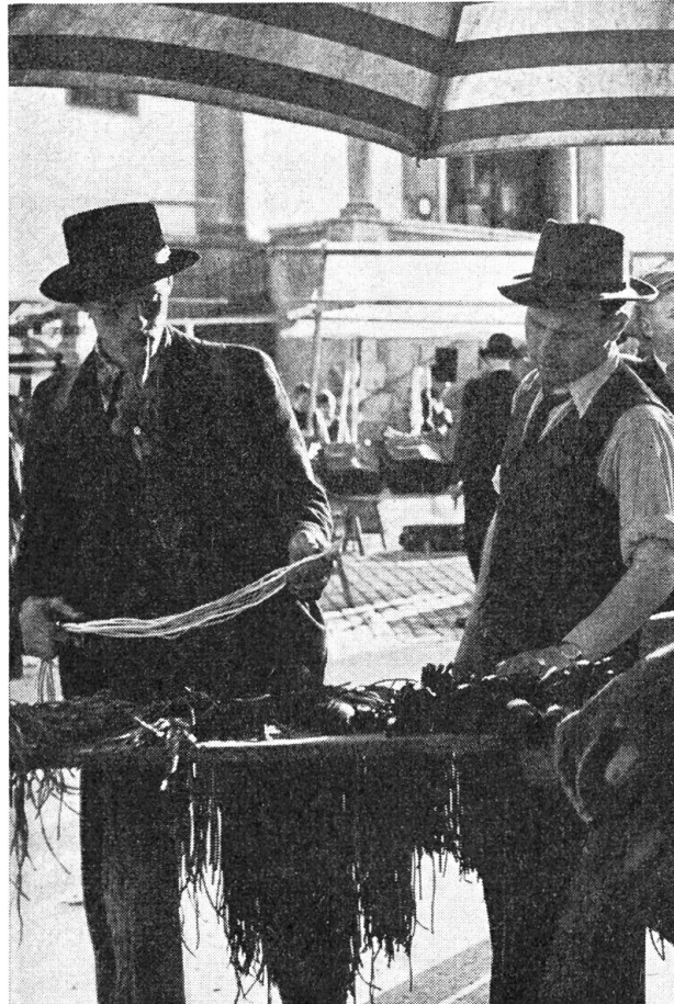
Wägen und wählen

Auf dem Rückweg hat der Bub ein Reh gesehen, wie es in weitem Sprung im Gesträuch verschwand, schlich ihm nach, immer weiter ins Gebüsch und unter die hohen Stämme und fiel in den Bach. Eingeklemmt zwischen den Steinen rief er, bis an die Brust im Wasser, um Hilfe. Das Rauschen und Toben des Baches übertönte die dünne Stimme. Während Dieter zitternd fror, die Dämmerung in den Wald sank, rannte seine Mutter auf allen Wegen, rief tausendmal seinen Namen, frag-