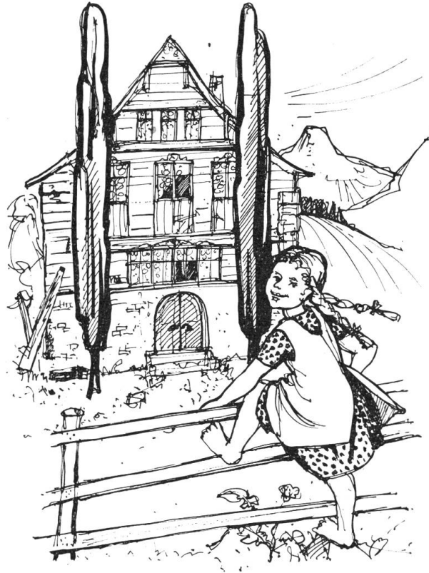
Vreneli fletterte wie ein Wiesel über den Hag und sprang auf die Lehmatt zu

„Er hat es nur gekauft, weil die auswärtige Fabrik darnach gezüngelt hat“, sagte Anna mit Bitterkeit in der Stimme, „er wollte nicht, daß Fremde hier einziehen und so viel Land und Wald unseren Leuten weg-