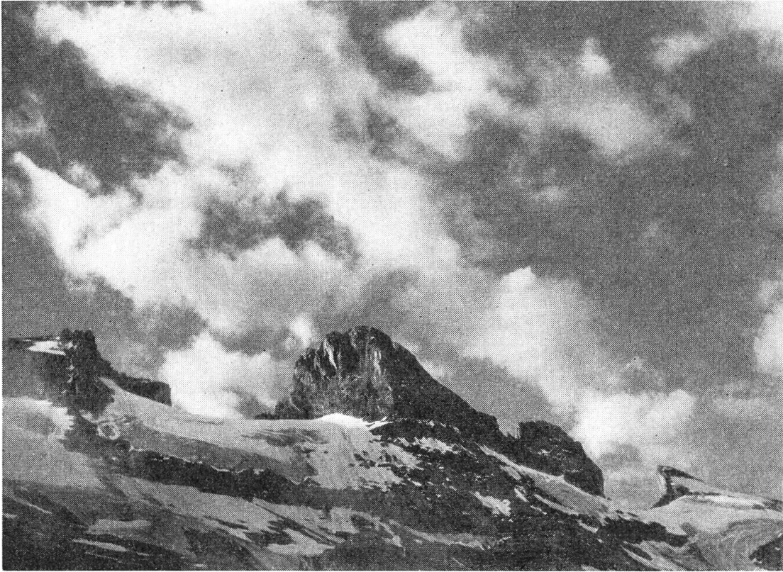
Wendensstöße im Morgenlicht