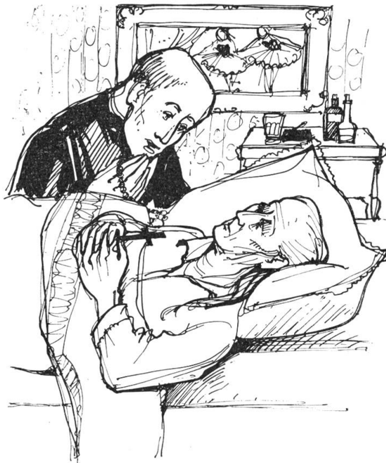
Hoffend, der Arzt möge noch rechtzeitig kommen