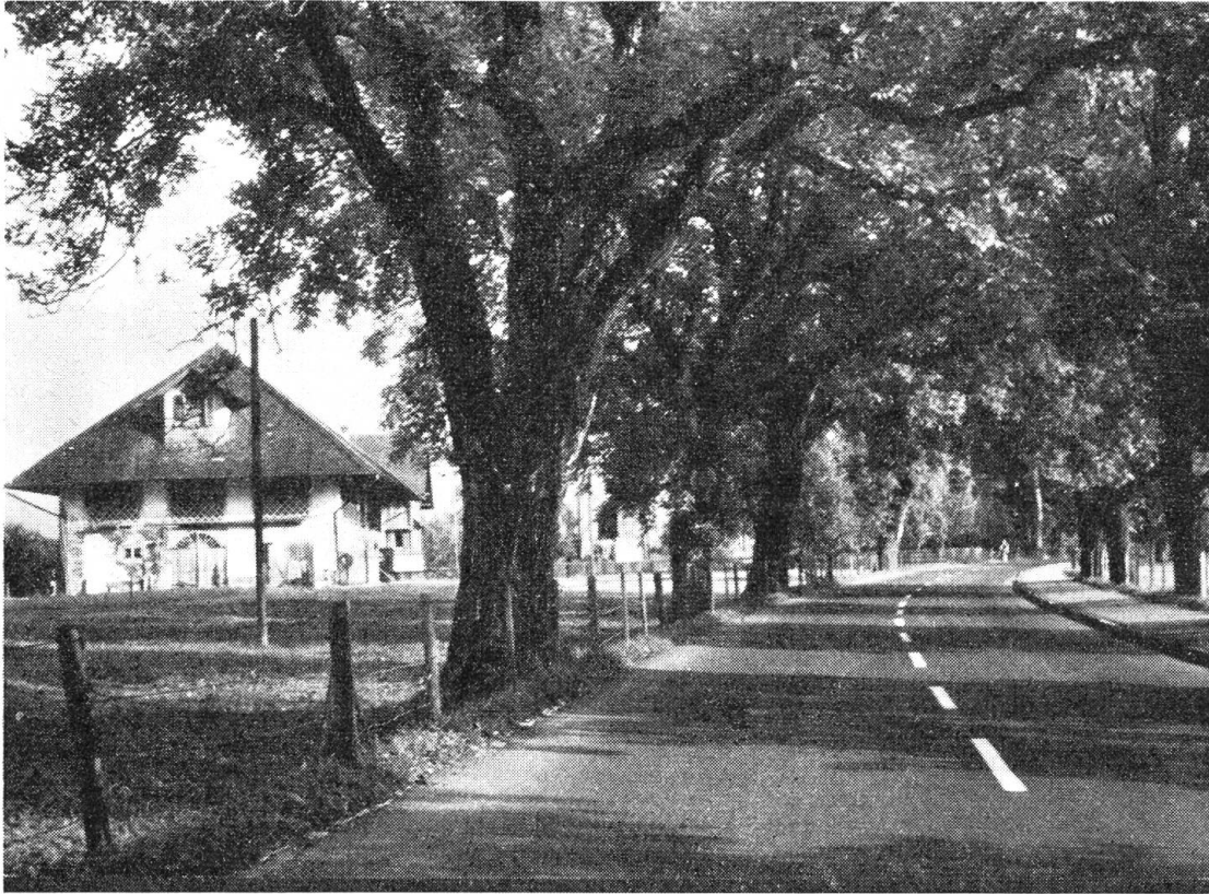
Die Nußbaumallee im Stanser Niederdorf, die dem übermächtigen Verkehr weichen mußte.