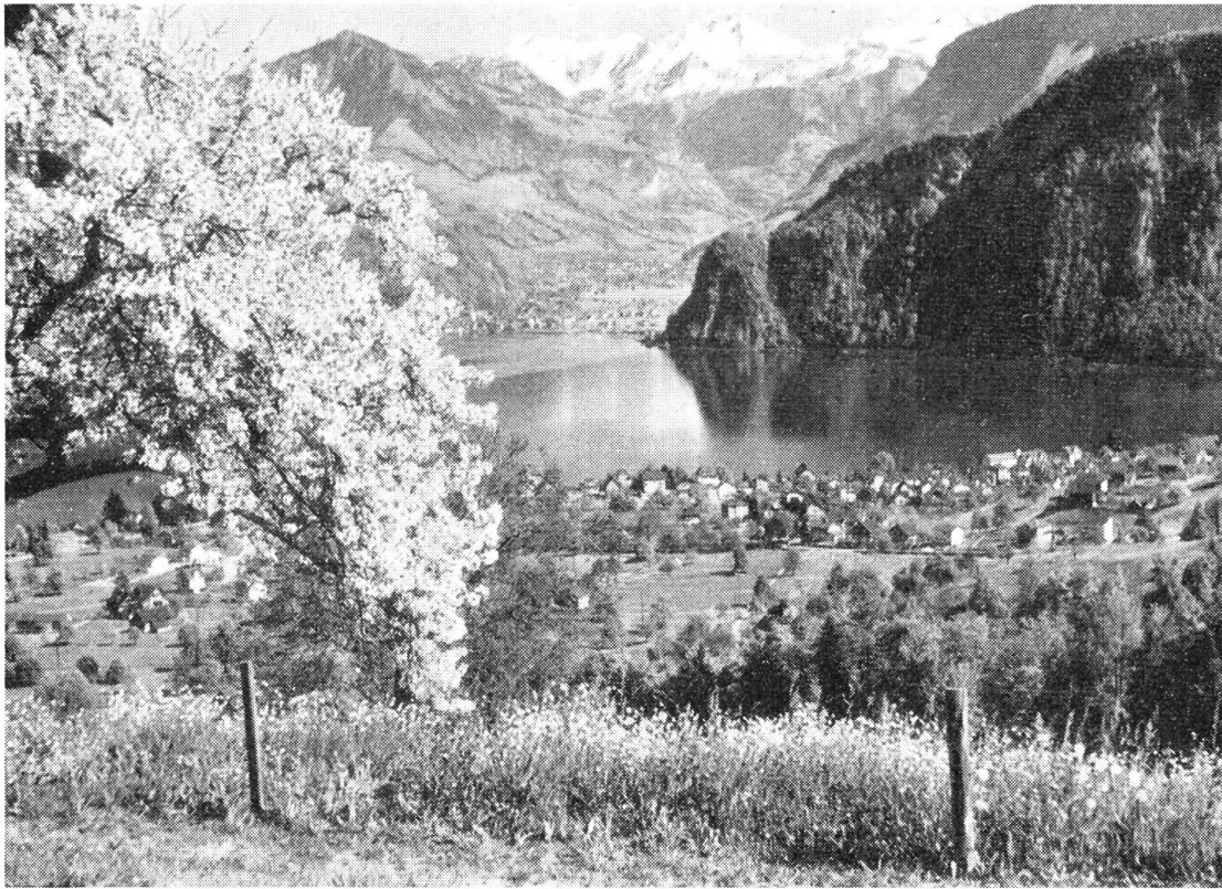
An diesem steilen Copper muß sich die Autobahn ihren Weg suchen