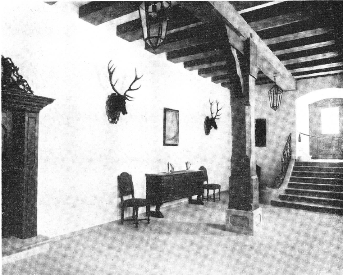
Das Erdgeschoß des Stanzer-Rathauses wurde zu zwei eindrucksvollen repräsentativen Räumen ausgebaut. Stilgerechte Möbel, vortrefflicher Wandschmuck und ausgezeichnete Arbeiten einheimischen Kunsthandwerks zieren sie. Unser Bild zeigt den Blick vom Portal aus; im Hintergrund die obere Rathhaustüre, links der prunkvolle Eingang zur Ratsstube.