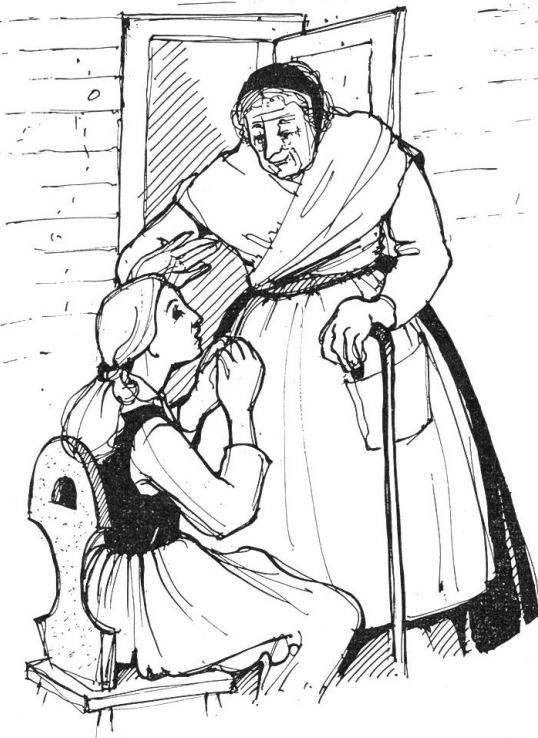
Mit milder Hand hat ihm die alte Frau über die Wangen gestrichen

Die Frau kommt zum Stuhl an den Tisch und sagt: „Auch ich wäre gerne mit den andern fortgezogen, glaub mir. Aber ich habe Dir vor Gott Treue geschworen“. „Warum fort?“ fragt Zeno. „Unterbrich mich nicht, ich will es Dir sagen. Du weißt, alles hat