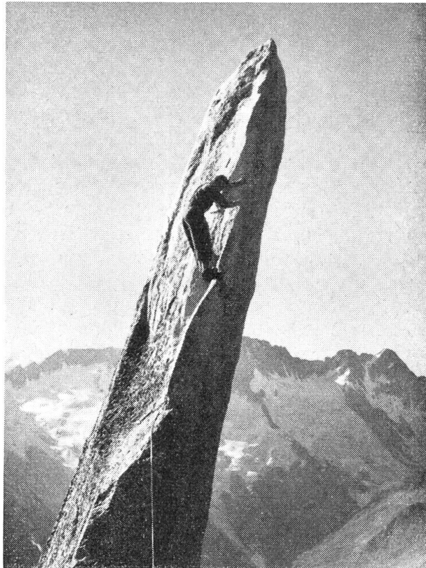
Die Nadel lockt

tätigkeit, dürften natürlich nicht die alten Möbel und abgewetzten Stühle mitgenommen werden. Das Haus müsse zeitgemäß und bis in die letzten Einzelheiten einheitlich empfunden und könne nur so Zeuge sein, für den guten Ruf der Firma und für den feinsinnigen Geschmack des Besitzers. Nicht nur die Möbel und Vorhänge, auch die Bilder, wurden vom Architekten ausgewählt und bestimmt.