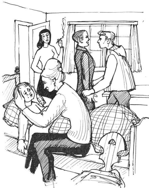
„Wollen Sie jetzt gehen oder fliegen?“

So nahe am Feuer knisterte das Gespräch. Keine Antwort blieb es ihm schuldig. Schlagfertig und witzig spielte es den Nußknacker. Bärti verteidigte sich: „Ich weiß schon, wenn ich nur ein klein wenig aufmache, dann springt die Schale ganz auseinander“. „Ja