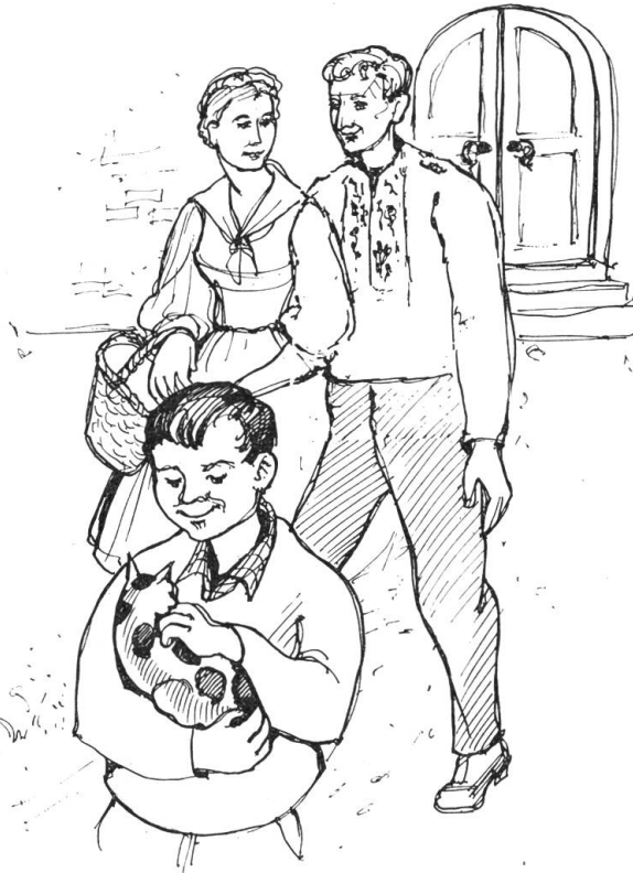
Drei glückliche Herzen wanderten während dem Betläuten durchs Dorf

Die Spannung wird unerträglich. Zeno atmet schwer, versucht etwas zu sagen und schweigt wieder. Endlich legt er die Faust auf den Tisch und ruft: „Mach schon, hol das Geld. Ich muß wieder gehen“. Der Lehmatz-