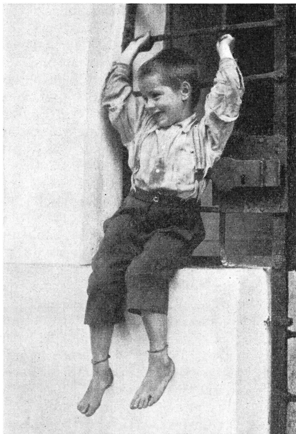
Bei der Frentschberger Kapelle

So blieben Vater und Mutter allein, lasen wieder in dem Brief und deuteten jeden Satz. „Daß er viel Geld verdient der Zeno, das habe ich auf Umwegen auch vernommen. Vielleicht hat er doch ein schlechtes Gewissen und will es darauf ankommen lassen, ob wir