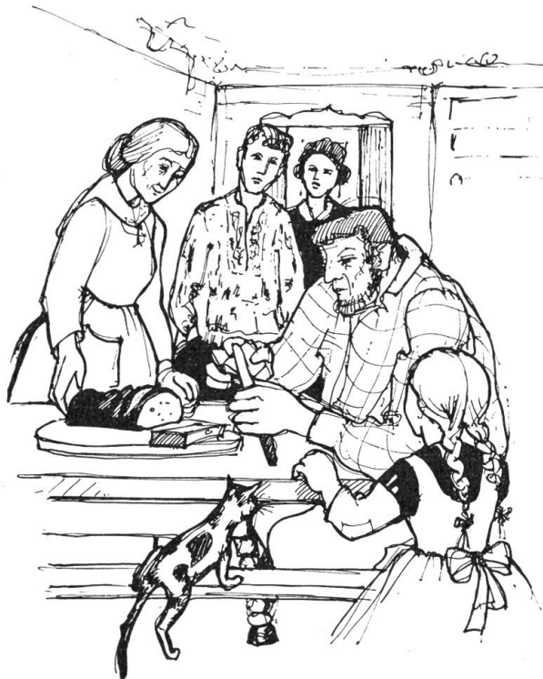
„Vater, sag mir, wie viel hast du bekommen?“

Tapfer und aufrecht, aber noch aschebleich, brachte sie ihm die dampfende Schüssel und sagte: „Tröste Dich. Wenn er nicht verkauft hätte, dann wäre für uns auch nichts abgefallen. Wir haben ein paar Tage in der Freude und in der Hoffnung gelebt. Es waren herrliche Tage. Nun gehen wir wieder