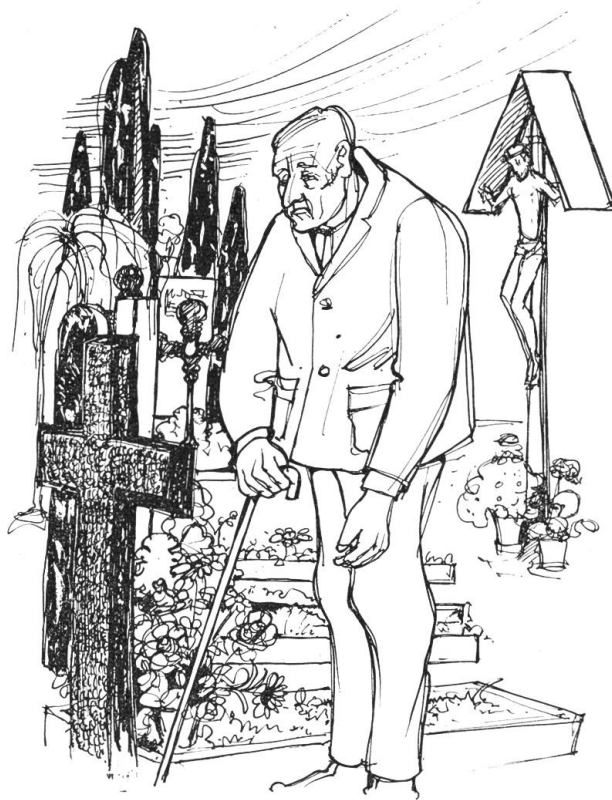
Und er steht da wie ein Bettler

Die beiden Brüder schreiten neben einander die saftige Matte hinauf, im alten, währschafenen Bauernt tramp, gehen der strahlenden Sonne entgegen, in einen neuen, schönen Morgen hinein.