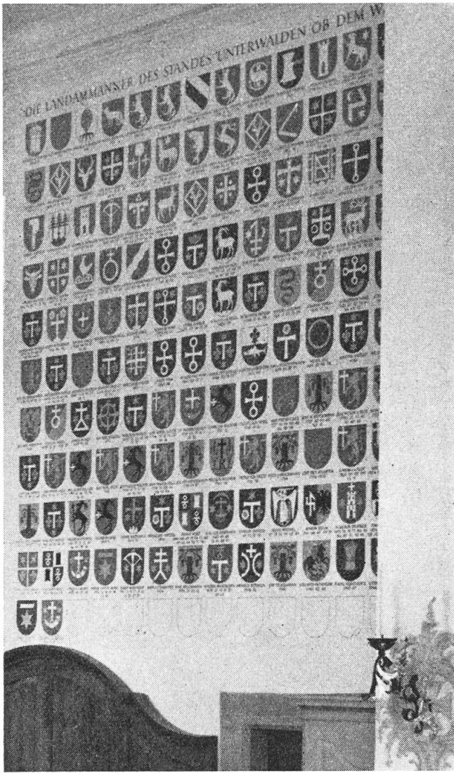
Die neuerstellte Wappenreihe der Obwaldner Ländammänner

getreue Nachahmung des Heiligen Hauses zu geben. Das neue Patrozinium fand in der Statue der Gnadenmutter von Loreto auf dem Hochaltar seinen bildhaften Ausdruck. Zu ihr pilgerten nun die Obwaldner in allen Sorgen und Nöten. Viele Motivtafeln und -Gaben beweisen noch heute das innige Vertrauen und die gewährte Hilfe.