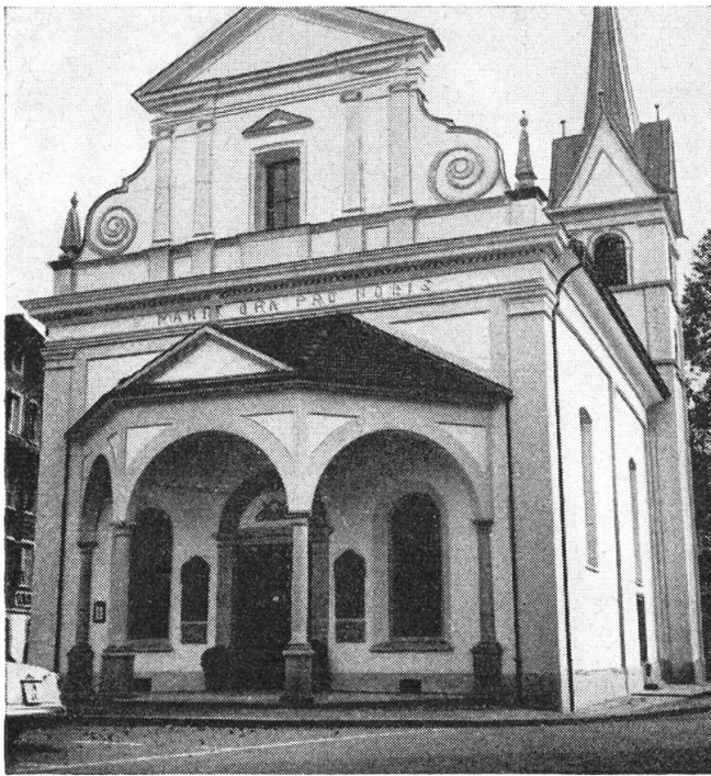
Die neurenovierte Dorfkirche Unserer Lieben Frau zu Sarnen

Wie sehr die Imfeld die Dorfkapelle als Familienverpflichtung betrachteten, zeigt die Stiftung einer Pfründe durch Landammann Melchior im Jahre 1605. Allerdings wurde diese zeitlich beschränkt durch eine Klausel, laut welcher das ganze Stiftungskapital beim Bau eines Kapuzinerklosters auf dieses übertragen werden sollte. Die Ansiedlung der Kapuziner war für Melchior Imfeld ein Haupt-