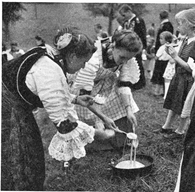
Nidwaldner Bratfäs nütt serviert

äußersten Vorsprung einer Geländezunge, von drei Seiten vom See bespült. Das Gemäuer erhebt sich auf einem Grundriß von 9 \times 9 Meter in fünf Stockwerken zu einer Höhe von 16 Meter. Heute stehen nur mehr die Mauern; sämtliche Stiegen und die Dielen, welche einst „Säle“ bildeten, sind 1798 verbrannt. Da an der alten Sandesbefestigung von 1300 auch Obwalden mitbaute, ist der Turm heute noch zu zwei Dritteln als Obwaldner Eigentum eingetragen. Etwaige Reparaturen oder eine Wiederherstellung müßte von beiden Kan-