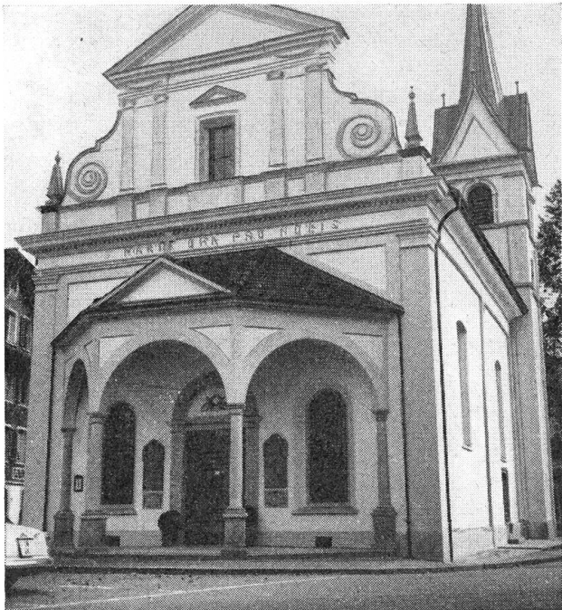
Die neurenovierte Dorfkapelle Unserer Sieben Frau zu Sarnen