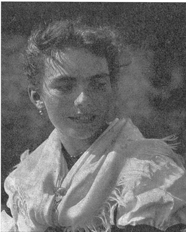
s'Rosli vo Siebeneich

Als die Oesterreicher in den vierziger Jahren des vorigen Jahrhunderts mit den Italienern einen Strauß auszusechten hatten,