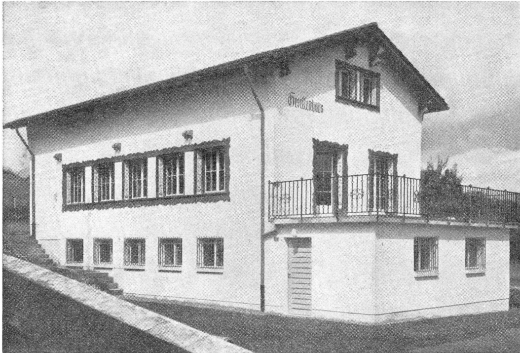
Das Gesellenhaus in Stans, von der Knirigasse aus gesehen