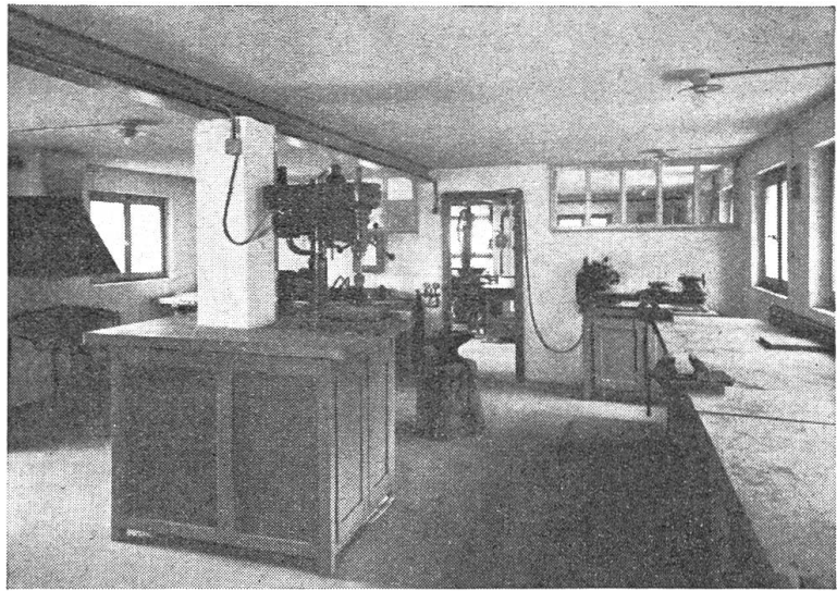
Die Freizeit-Werkstatt für Metallbearbeitung

Zwischen dem Fastnachtscherz und der Gefellenhausweihe am 30. Juli 1950 lag für die Gefellen noch ein weiter und ein krummer Weg. Einige von denen, die damals in der Breiten die Stangen aufgerichtet haben, sind längst fortgezogen, andere spazieren heute mit ihren Kindern oder gar mit ihren Töchterli, sind bereits würdige Herren im Amt und zeigen graue Haare an den Schläfen. Aber sie sind heute noch dabei, mit jungem Herz und hilfsbereiter Hand. Sie haben den Verein im Jahre 1932 gegründet. Sie haben Freizeitarbeiten angeregt und die gelungenen Produkte in