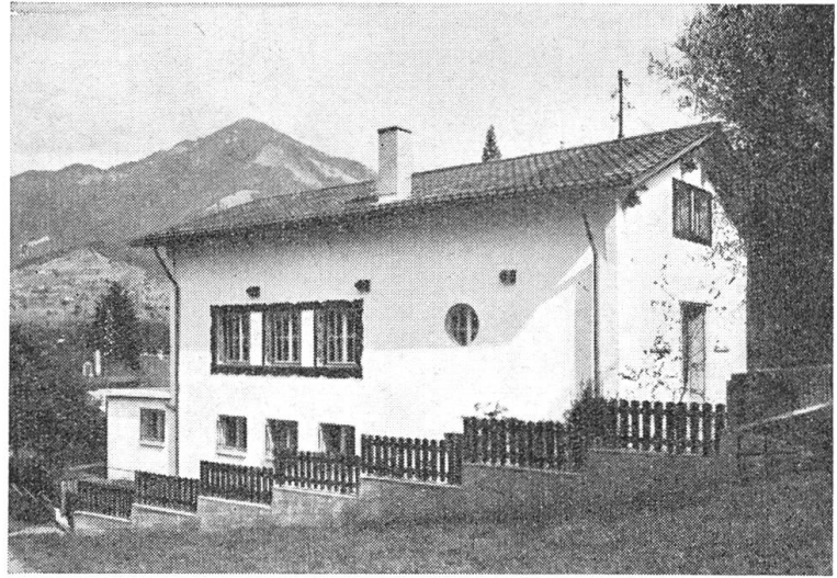
Gesellenhaus-Ansicht von der Westseite

Was die Gesellen in den Vorträgen gehört, was sie als Programm in ihren Sätzen hochhalten, das haben sie in diesem Haus zur Tat werden lassen. Jeder Fensterrahmen, jedes Schmiedeisenstück, jedes Möbel, alle kleinen Einzelheiten zeigen Qualitätsarbeit. Geräumig und zweckmäßig, praktisch und leistungsfähig sind die beiden Werkstätten für Holz- und für Metallarbeiten. Geschmackvoll ausgebaut und heimelig eingerichtet ist der Vortragsaal, der durch eine bewegliche Wand in eine große und eine kleine Stube verwandelt werden kann. Eine wahrschafte Balkendecke, schmutze Vorhängli, hübsch abgetöntes Holz, eine Eckbank zieren den gemütlichen Raum. Gegen den Winter zu und im frühen Frühling wird im offenen Kamin ein munteres Feuerlein bren-