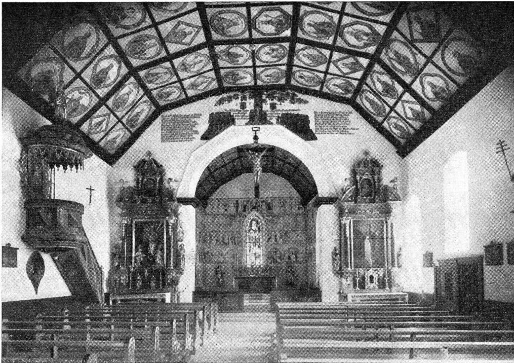
Das Innere der neu renovierten Kirche St. Niklausen

Vorerst aber sei hier etwas aus der Geschichte der Kirche St. Niklausens erzählt. Cirka 30 Jahre vor der Schlacht bei Sem-