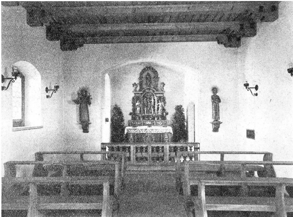
Innenansicht der neuen Kapelle auf Klewenalp

Dies ist in kurzen Worten die Vorgeschichte, hinter welcher so viel Mühe und Sorgen der Kommissionsmitglieder verbor-