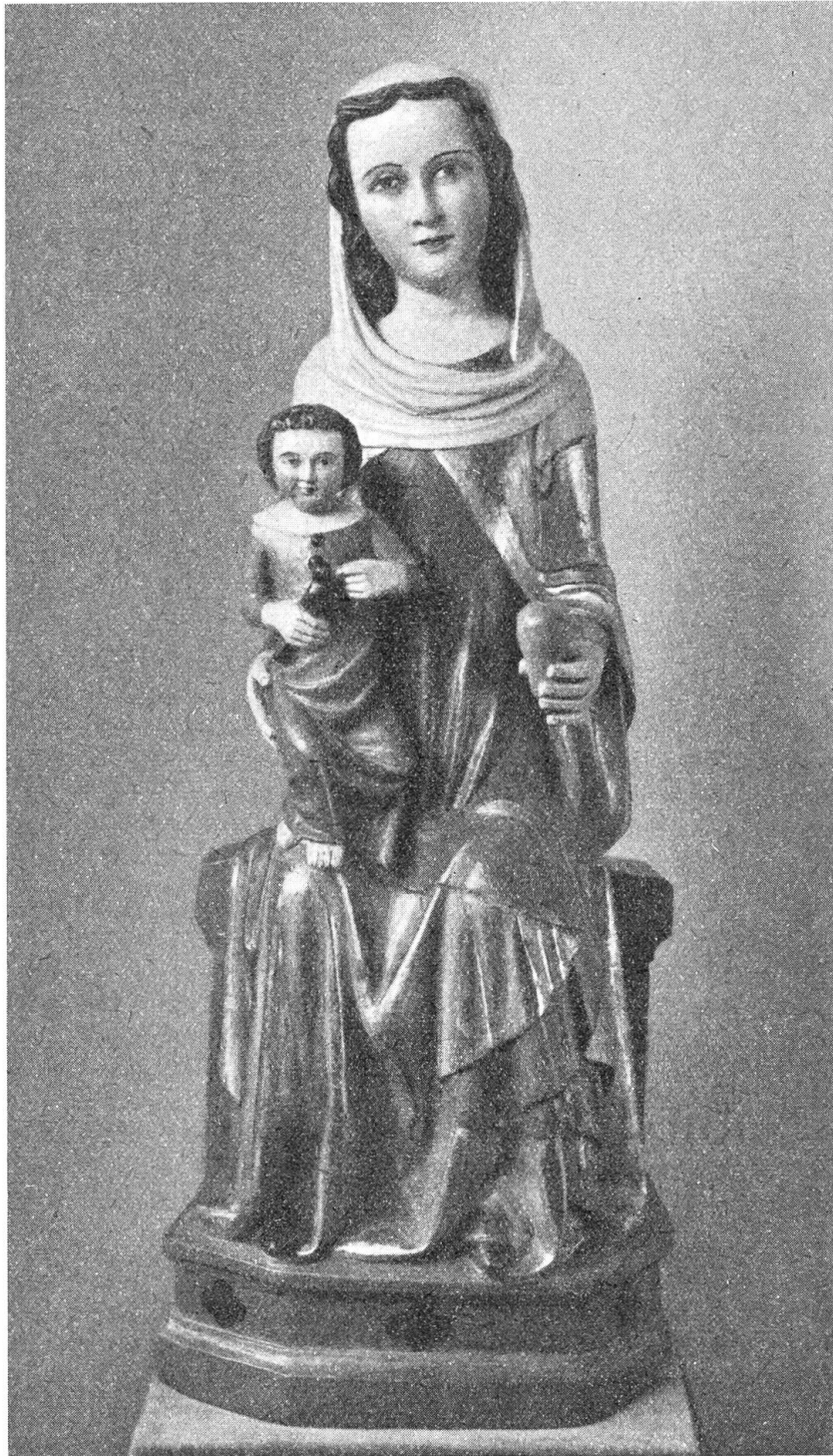
Unsere liebe Frau von Niederrickenbach