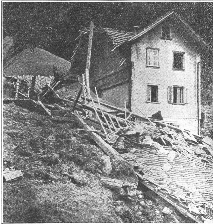
Am 11. August 1933 ging über Stans-Oberdorf ein Unwetter nieder. Die großen Wassermassen verursachten etliche Erdrutsche. Unser Bild zeigt ein stark beschädigtes Haus in der Kehle ob Stans.

Paul begegnete weit unten dem vom Dorfe heimkehrenden Ratschherr. Am liebsten hätte er ihm seine beiden harten Fäuste ins Gesicht geschlagen. Der Ratschherr war doch gewiß nicht daran schuld.