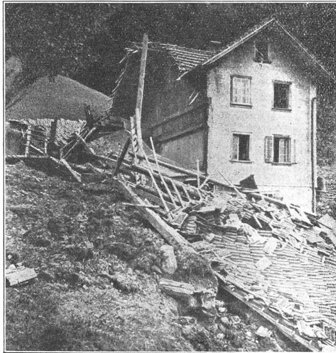
Am 11. August 1933 ging über Stans-Oberdorf ein Unwetter nieder. Die großen Wassermassen verursachten etliche Erdrutsche. Unser Bild zeigt ein stark beschädigtes Haus in der Kehle ob Stans.

Paul begegnete weit unten dem vom Dorfe heimkehrenden Rats herr. Am liebsten hätte er ihm seine beiden harten Fäuste ins Gesicht geschlagen. Der Rats herr war doch gewiß nicht daran schuld.