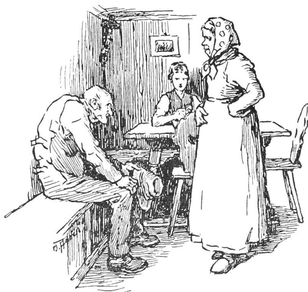
Zulezt stellte sie sich breit vor den Besucher hin.