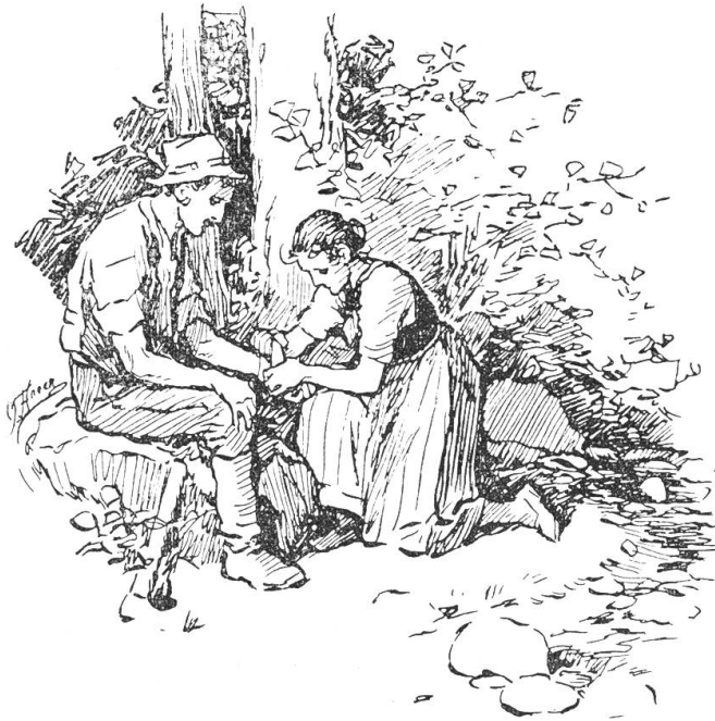
„Gib her“, antwortete Elsi und verband mit Sorgfalt und Zittern die blutende Hand.

für die Gefühle der Tragerin viel zu wenig poetisch und sie entgegnete spitz: „So meinst du, das steht dann noch nirgends geschrieben, besonders wenn es Elsi sein sollte.“ — Jetzt hätte Rosmarie dem Balz ins Gesicht sehen sollen, statt davon zu laufen. Dort wäre deutlich zu erkennen gewesen, was beide Schwestern so eifrig zu enträtseln versuchten ... Balz blieb stehen wie ein begossener Budel. Da sah er Elsi in den Hühnerstall gehen und schritt ihr kurz