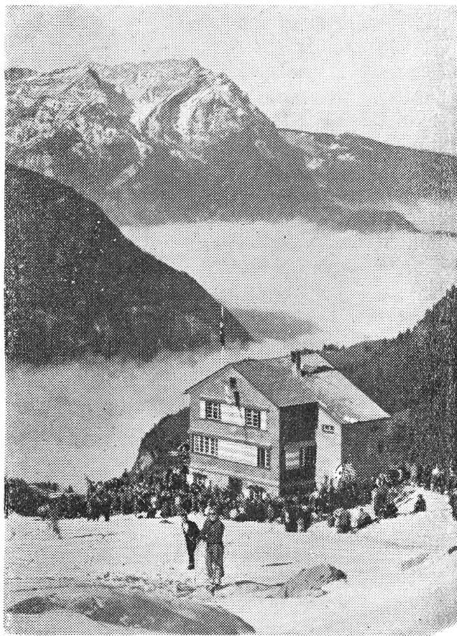
Das Brisenhäus, eine der schönsten Clubhütten wurde letzten Winter eröffnet.

Stadtleute haben uns Vieles voraus, was Umgangsformen und Besuchsroutine anbelangt. Der Geometer blieb auch kaum eine Stunde auf Sonnenberg, ließ sich aber die