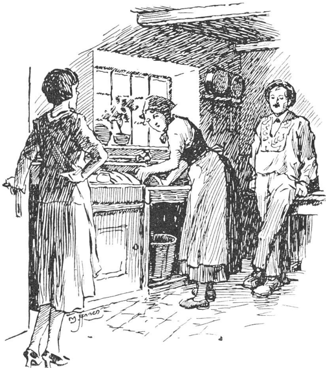
Da stand ein junger fremder Bauersmann am Küchentisch.

höre. „Denn“, sagte er, mit erhobener Stimme: „Elsi, schlag dir den Balz aus dem Kopf; daraus wird nichts, verstehst du!“ — Elsi fragte darauf mit niedergeschlagenen Blicken, ob sie heute oder erst morgen gehen könne. „Mach, wie du es willst“, entgegnete der Ratsherr, und legte den Lohn vor sie auf den Tisch. Elsi nahm das Geld, ging in die Waschküche, holte dort aus dem großen Zuber ihre „eingedrückten“ Rastüchlein und die Wäschestücke und fing ohne langes Zögern an, ihr Köfferchen zu packen. —