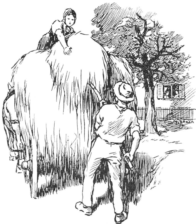
Sie legten beide die Arbeit nieder um ganz genau betrachten zu können —

In jener Spätherbstnacht hat aus der Mägdekammer auf Sonnenberg lange ein Licht geleuchtet, denn dort waren emsige Hände eifrig bemüht, ein weißes Wäschestück auszubessern.