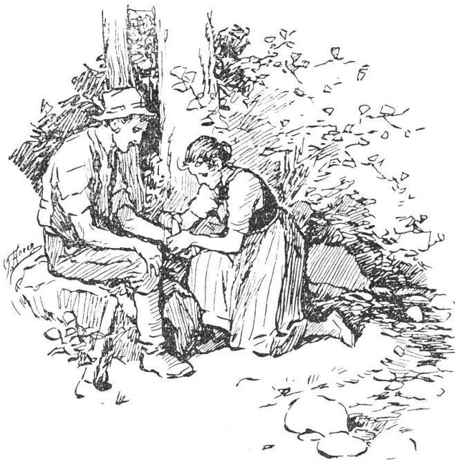
„Gib her“, antwortete Elsi und verband mit Sorgfalt und Zittern die blutende Hand.

für die Gefühle der Fragerin viel zu wenig poetisch und sie entgegnete spitz: „So meinst du, das steht dann noch nirgends geschrieben, besonders wenn es Elsi sein sollte.“ — Jetzt hätte Rosmarie dem Balz ins Gesicht sehen sollen, statt davon zu laufen. Dort wäre deutlich zu erkennen gewesen, was beide Schwestern so eifrig zu enträtseln versuchten... Balz blieb stehen wie ein begossener Pudel. Da sah er Elsi in den Hühnerstall gehen und schritt ihr kurz