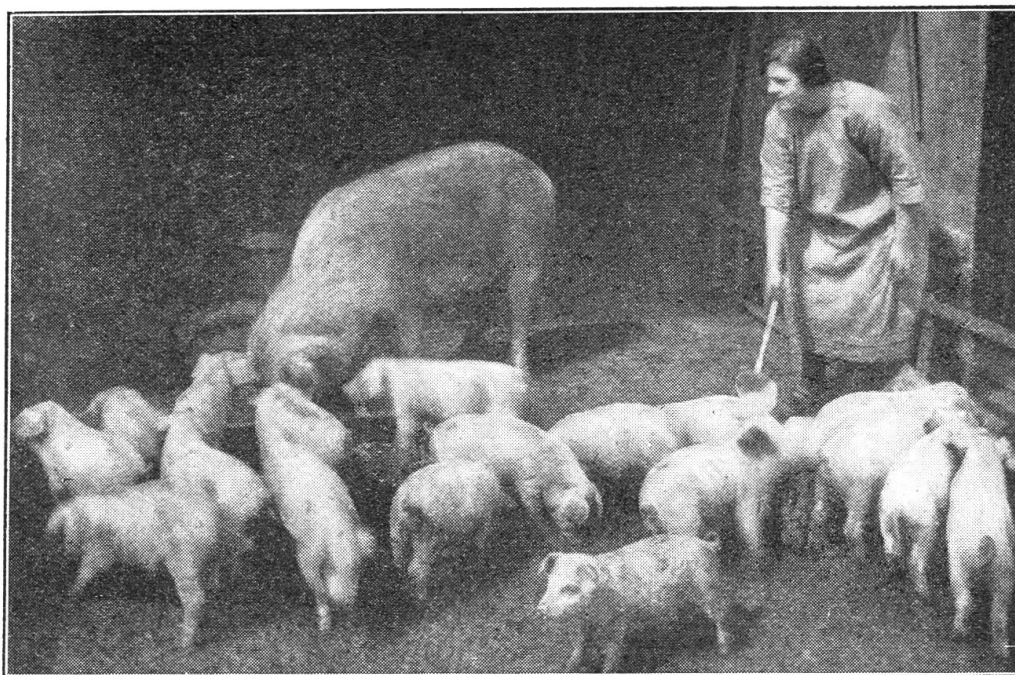
Ein Sau-Glück! 19 Ferkel in einem Wurf!

der in der angenehmen Form der Unterhaltung ausgeübt wird. Das Spielzeug lehrt, ohne zu schulmeistern. Es soll einfach und waschbar sein; giftige Farbe, aber auch Haare dürfen sich nicht an ihm finden. Aus den Kautschuktieren und -Puppen sollen die Pfeisfen entfernt werden, da dieselben oft aufgerissen und in den Mund gesteckt werden; von da aus geraten sie oft in den Rachen und in die Luftröhre, aus der sie nur schwierig und nicht immer zu entfernen sind; bleiben sie liegen, so führen sie den Tod des Kindes herbei. Ebenso darf dem