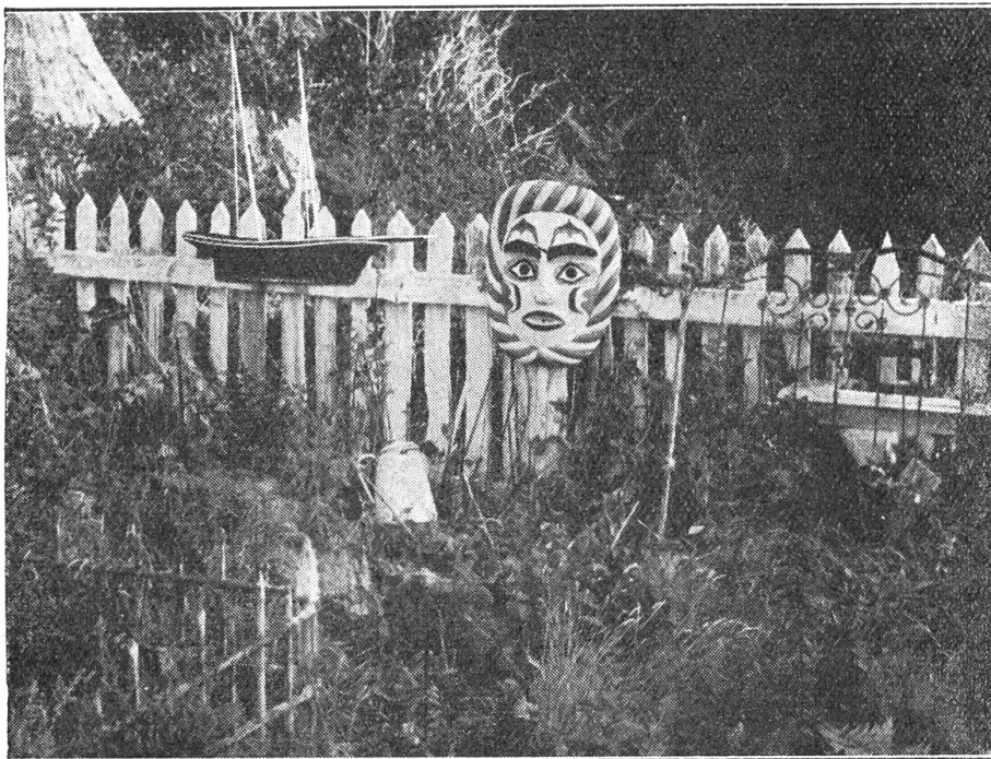
Indianergräber an der Westküste von Kanada.

Morgens reiche man Milch, jedoch in einer Tasse und nicht in der Flasche, wie dies oft aus Bequemlichkeit geschieht. Zeigt sich Widerwille gegen die Milch oder Appetitlosigkeit bei den folgenden Mahlzeiten, so setze man der Milch Malzkaffee zu (kein gewöhnlicher Kaffee, auch nicht Kaffee Hag). Dazu gebe man Zwieback oder Toast, später Brot. Vollmehlbrot (Toblerbrot) ist dem Weismehlgebäck vorzuziehen.