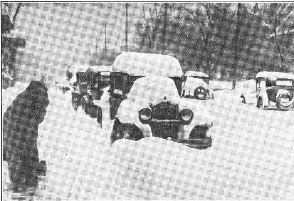
Während bei uns der Schnee fast ganz ausblieb, wüteten in Amerika Schneestürme, die ganze Autokolonnen innert kürzester Zeit vollständig einschneiten. Die Aufnahme wurde in Canzas City gemacht.

Das einjährige Kind hat bei ungestörter Entwicklung eine Körperlänge von 75 cm erlangt. Sein weiteres Wachstum verlang-