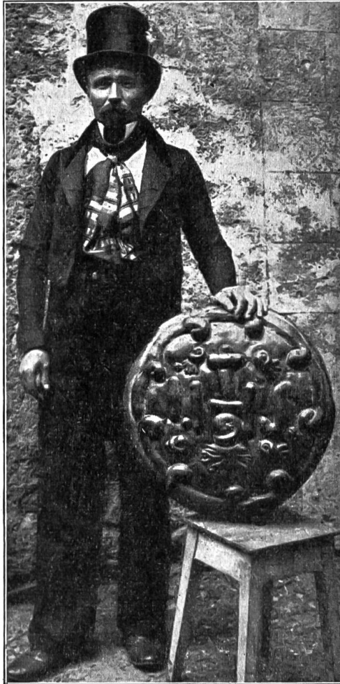
Götti mit Gvatterbrot (Wallis).

Der Vater und Hans, die zogen immer noch an ihrem Stumpen Arbeit und tranken von den alten Vorräten, die vom Vater bis auf den letzten Tropf zum Austrinken bestimmt waren. Es waren zwei Regierungen auf dem Sunnacher und keine richtete etwas aus.