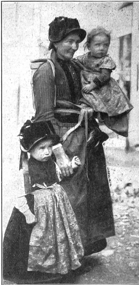
Lötschentalerin mit Kindern.

Und sie stieg langsam, sich haltend, die schmale, steile Holztreppe hinab in den Raum, der als Ausgang und Küche zugleich diente. Ein Windstoß hatte die Haustüre zugeweht, zu welcher Hans hinausgejagert war. Sorgfältig öffnete Christine sie wieder und befestigte sie mit einer Stobelle, damit sie offen bliebe. Sie lauschte