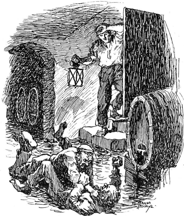
„Er hat mich; er hat mich!“