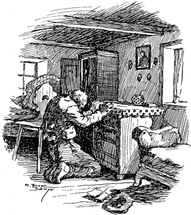
Laut gellten diese Worte auf den verdunkten Mann ein.

Heute mußte Anna die Beter zusammenrufen, aber nur Adolf und Thedori ließen sich herbei. Eintönig klangen ihre Worte, und die Gedanken gingen stets denselben Weg: der Vater — das gemeinsame Elend. Die beiden Männerstimmen erstickten fast im Flüsterton. Ja, sie waren des Elends müde. Das Beten nützte nichts mehr. — Sie verziehen es dem Bruder, daß er nicht dabei war. Ob sie selbst auch zu beten aufhören wollten, darüber grübelten sie nicht. Sie beteten, weil die Mutter selig sie so