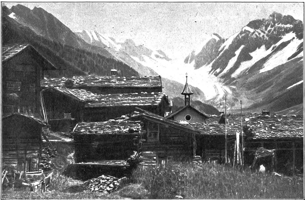
Weißerried im Lötschental.

von jenen, wo der äußere Schein, die oberste Haut ihres Wesens Rechtschaffenheit, fluge Lebenserfahrung und Gablichkeit bedeutet. Und ebenso im innersten Herzensfünkeln lebte bei ihm Glaube, Zerknirschung und stürmisches Flehen. Aber was dazwischen lag, zwischen dem innersten Fünkeln und der äußersten Haut, das war zerfressen von einem bösen Wurm, der Mark und Gebein, Fleisch und Nerven zernagt. Wer nur des Sunnacherers Gesicht sah, etwa am Sonntag auf dem Kirchplatz, oder an einem Markt,