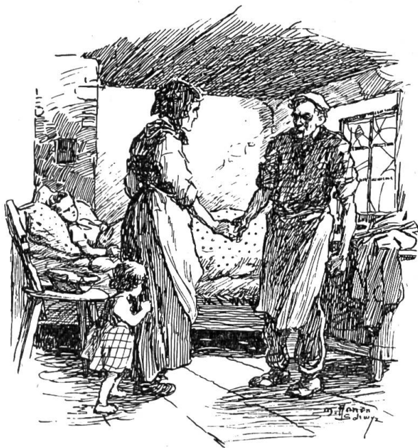
"Und dort solls dann anders gehen!"

"Ihr werdet ihm doch noch Lohn auszahl haben?", forschten sie.