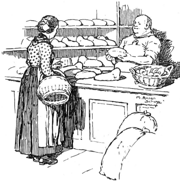
„Sie will Vollbrot.“

Brot bleibt eine Woche lang gleich eßbar. Das weiße ist nach zwei Tagen schon weich und tangg oder hart und spröde. Das wird seinen Grund darin haben, daß das weiße Brot eine weichere Struktur hat und darum viel empfindlicher ist für die umgebende trockene oder feuchte Luft. Nun, wie geht's? Weder pantschiges noch steinhartes Brot will man essen und deshalb ist man bei Weißbrot darauf angewiesen, immer möglichst frisches zu halten. Und kommt's noch ofenwarm aus der Backtube, mit um so größerem Hallo stürzen sich die Kinder auf dieses Pudding. Und doch ist den lieben Mitlandleuten schon viel duzend mal gesagt worden, daß wir mit dem täglichen weichen Brot die Zähne verhätscheln und verbabeln. Was nicht arbeitet, das verweichlicht. Ein