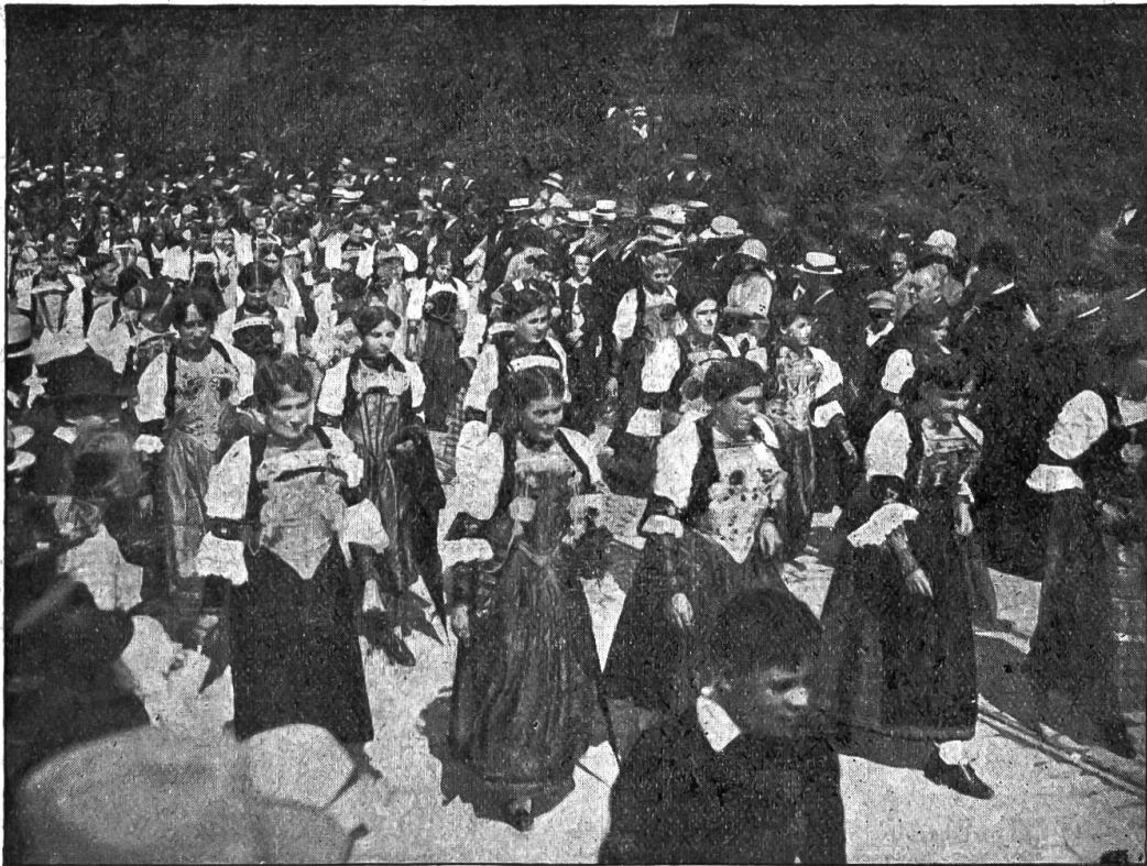
Schweizerischer Katholikentag in Basel. Nidwaldnermeitschi in ihrer schönen Tracht im Festzuge.

Er ist e Vali bis anefir uise, Drum megemer nie mit enandere g'huise.