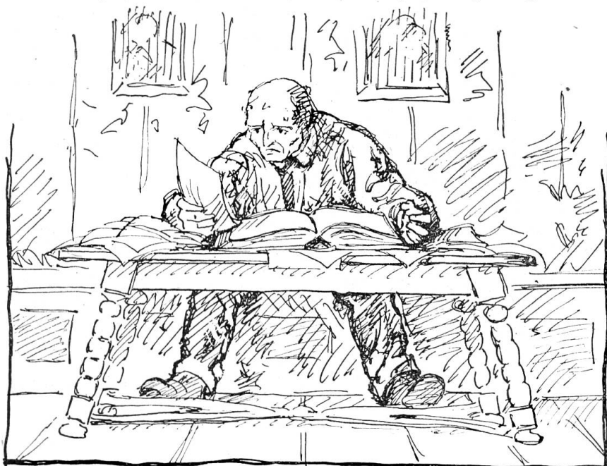
In der Stube sitzt ganz allein der Habeggbauer.

Am Hochzeitstag des Lötcher Sepp, da hatte die Marthe mitten in der Nacht ihr ganzes Hab und Gut vergraben, draußen bei der alten Wettertaune bei der großen Einfahrt. So viel schon hatte sie in junger Lieb und Hoffnungslosigkeit zusammen-gespart, aber sie wollt's nimmer sehn, das Büchlein, das ihr der Sepp so oft in die Stadt getragen. Fast das Herz hat's ihr abgedrückt, wie sie's im Blechfessel verscharrte. Begraben sollt es sein, wie sie die Lieb begraben wollte. Dann war sie in ihre Kammer geschlichen, und hatte beim Kerzen-