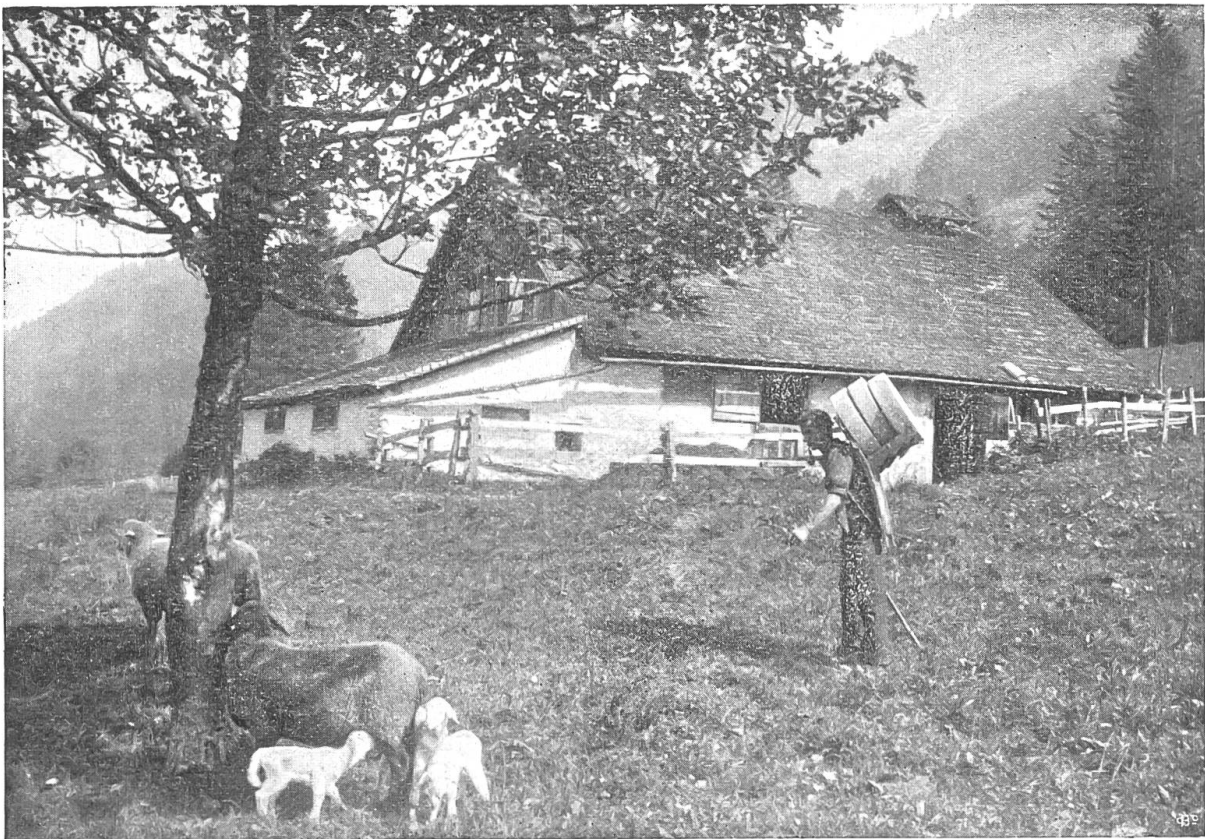
In den Meichtaler-Alpen.

bauer letztes Jahr ersteigert hat. Das würd' ihm passen. Betreiben? — Er faßt einen Briefbogen. Es liegen viele auf dem Tisch. Wenn er den Erlemoos-Lötscher betreiben würd'? Er liegt zwar todkrank im Bett, und die Leute sagen, es könne nimmer lang mit ihm gehen. Er war auch manches Jahr Oberknecht auf der Habegg — aber was geht das schließlich den Bauern an? Betreiben? Wenn er's grad täte? Dann würd' das Untererlenmoos ihm gehören, be-