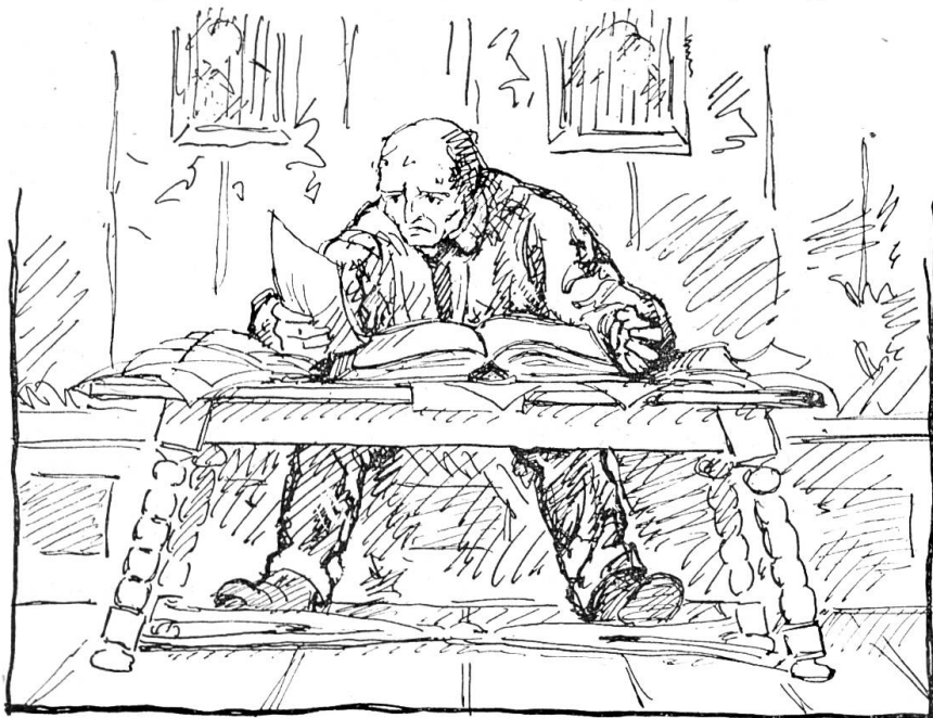
In der Stube sitzt ganz allein der Habeggbauer.

Am Hochzeitstag des Lötcher Sepp, da hatte die Marthe mitten in der Nacht ihr ganzes Hab und Gut vergraben, draußen bei der alten Wettertanne bei der großen Einfahrt. So viel schon hatte sie in junger Lieb und Hoffnungslosigkeit zusammen-gespart, aber sie wollt's nimmer sehn, das Büchlein, das ihr der Sepp so oft in die Stadt getragen. Fast das Herz hat's ihr abgedrückt, wie sie's im Blechfessel verscharrte. Begraben sollt es sein, wie sie die Lieb begraben wollte. Dann war sie in ihre Kammer geschlichen, und hatte beim Kerzen-