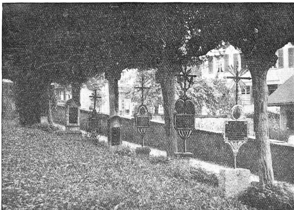
Friedhofkunst. Auf dem alten Friedhof von Stans.