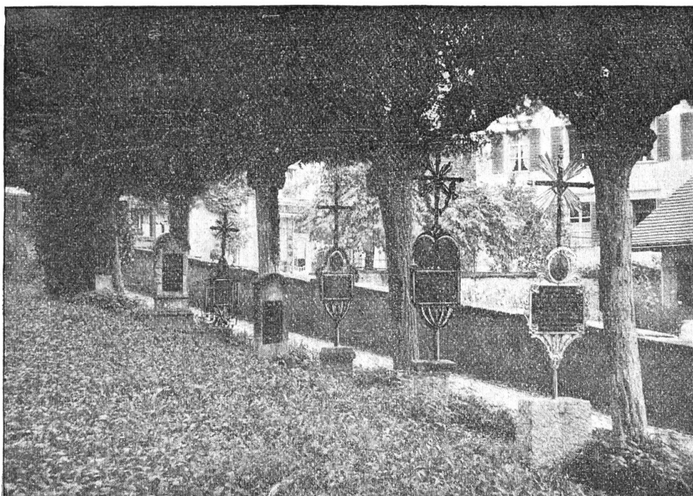
Friedhofkunst. Auf dem alten Friedhof von Stans.

„Aber gelt, Marthe, der Bueb hed dr agha: dr Vater isch chrank. Eier chann er no esse, und i ha mer nit anderst z'helfe gewüßt. Marthe, Marthe, verchlag mi nit bim Bur!“