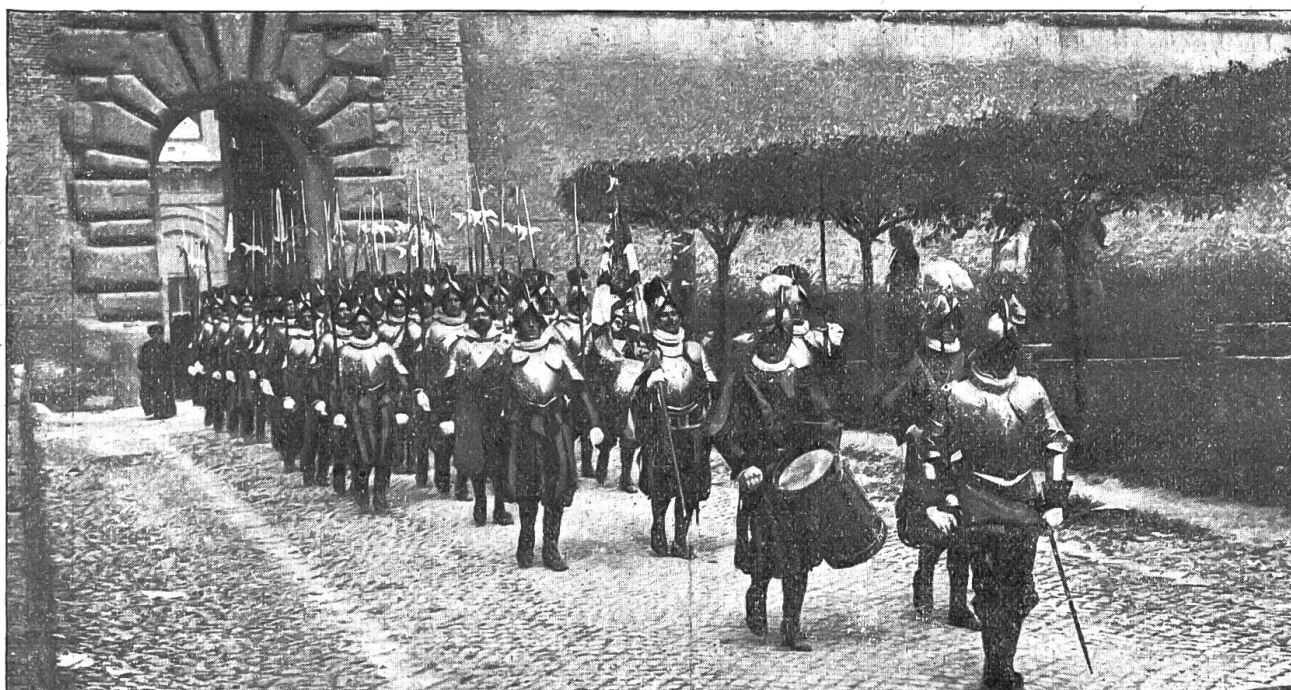
Aufzug der päpstlichen Schweizergarde zum Fahneneid.

landes. Wir sehen in euch nicht bloß die Söhne jener hohen Berge, von denen ihr Lehren der Treue, der Beständigkeit und Stärke empfanget für die treue Erfüllung der Pflichten unserer heiligen und christlichen Religion, ihr seid Uns Brüder jenes Bruders, den ihr „Bruder Klaus“ nennt und des sanften heiligen Bischofs von Genf, Franziskus. Ihr seid Uns nicht bloß die späten Nachkömmlinge Wilhelm Tells und eures rühmlichen Stauffacher, sondern vielmehr die neuen geistigen Kinder des Uns so teuren hl. Karl Borromäus, die treu und