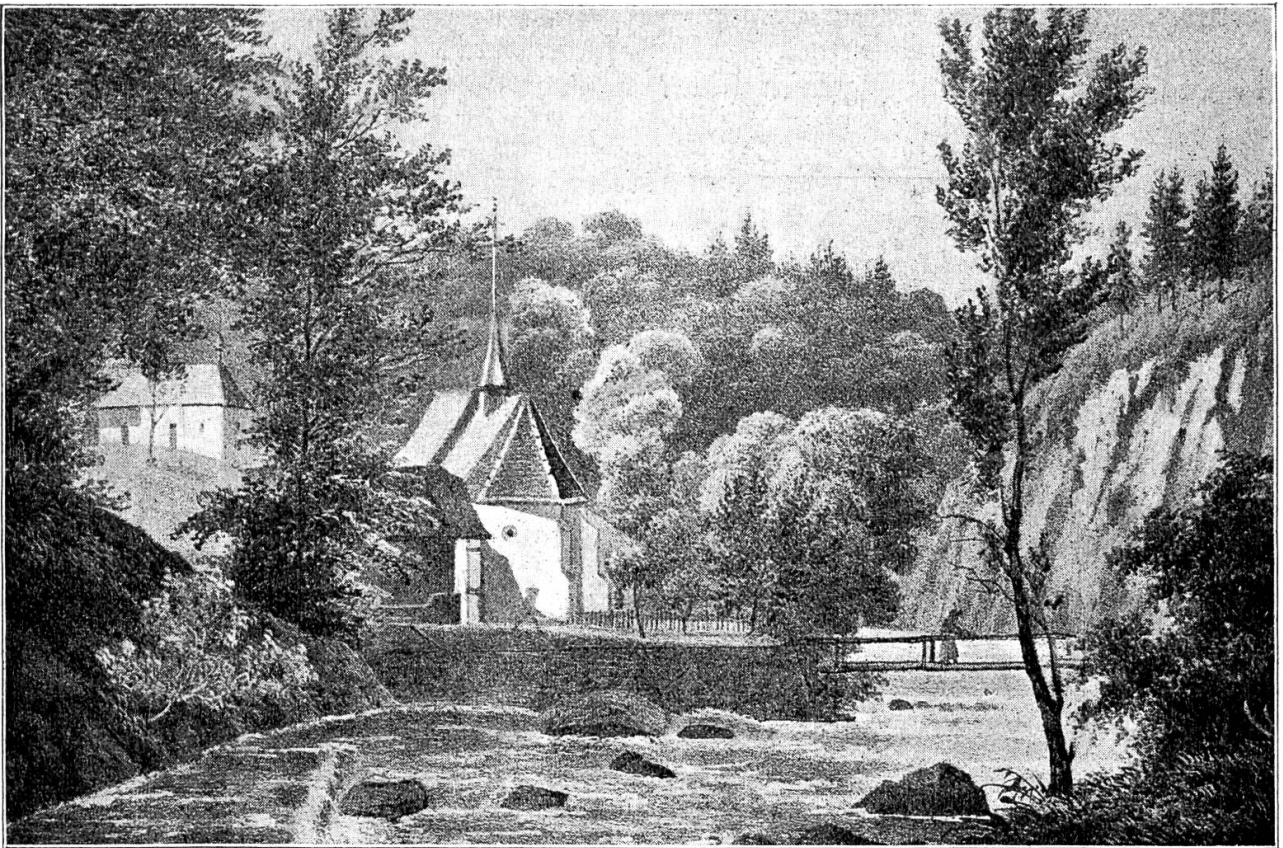
Die Einsiedelei im Naust nach einer Lithographie aus der Mitte des vorigen Jahrhunderts.