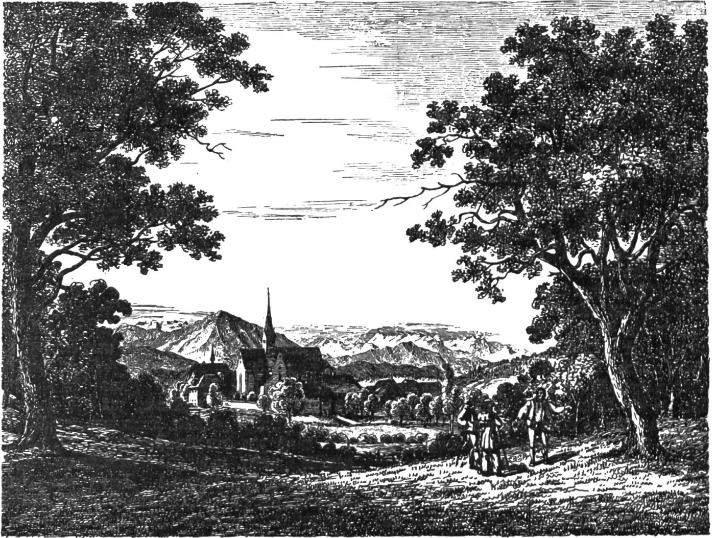
Kappel. Nach einem alten Kupferstich.

Eine Folge seines Kriegsrühmes und eine Anerkennung seiner Tapferkeit mag es auch ge-