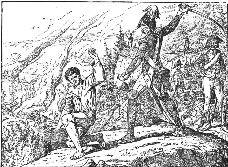
Er sah, wie der Hauptmann den Säbel zog.

daß er darauf dachte, nach Stanz zu gelangen. Dort hoffte er als Sohn eines Patrioten un gefährdet zu sein. Immer vorsichtig ausspähend verließ er die Rüben und erreichte die Heuweid im Oberwil. Da und dort lagen zahlreiche Leichen gefallener Franzosen, aber ach,