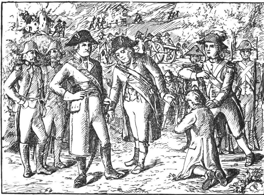
Während Schauenburg noch immer zögerte, trat plötzlich ein Soldat aus den Reihen der Zuschauer.

Da trat das Mädchen vor ihn hin, hochaufgerichtet und seine Augen starrten ihm durch's Dunkel entgegen. „Wie! Du, der Spillmutter-Franz! Du bist nicht mein Franz!“ rief es mit scharfer Betonung. „Du bist ein Feigling, ein Verräter! Weg, weg! Fort von hier!“