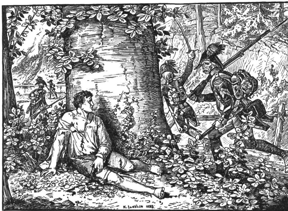
Mühsam richtete er sich auf und bemerkte einen Franzosen.

Wehklagend eilt die Ärmste weiter; Franz wendet seinen Schritt der Kirche zu; — neue Schrecken schaut sein Auge. Vor der Glockenhausthüre liegt der Schellenmaurus in seinem Blute; Franz schreitet an der Leiche vorbei und öffnet die Kirchthür. Entsetzlicher Anblick!