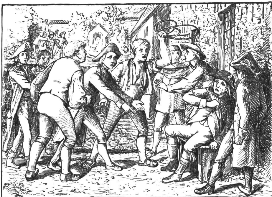
Jetzt ertaubete der Schnideri-Sepp und hob seine Gabelschnur in die Höhe.

„Was hat der Statthalter zu den Geistlichen gesagt?“ forschte Wendel weiter; „es ist ja einfältig, so über ihn herzufahren, wenn man nicht weiß, was der Mann verbrochen hat. Hast nichts