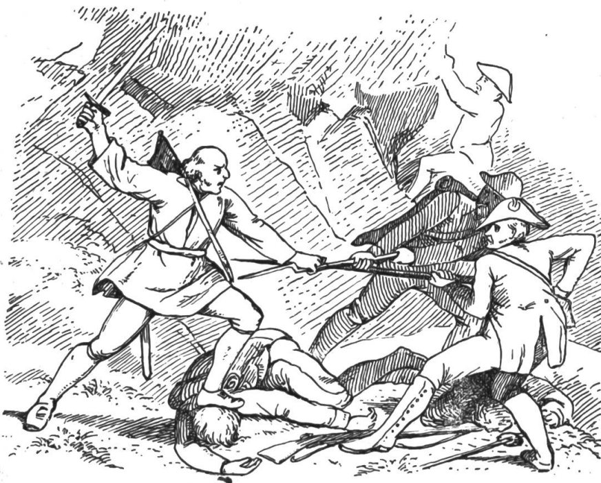
Ein Nidwaldner-Held von 1798.

Freiheit seines Gottesdienstes, über Sicherheit seiner Personen und seines Eigentums u. s. w. eingebläst habe. Doch wie ernst es die Franzosen mit solchen Versprechungen nahmen, zeigte sich bald. Wohin Schauenburg drang, da wurden die öffentlichen Kassen und Zeughäuser geleert, die Klöster gebrand-