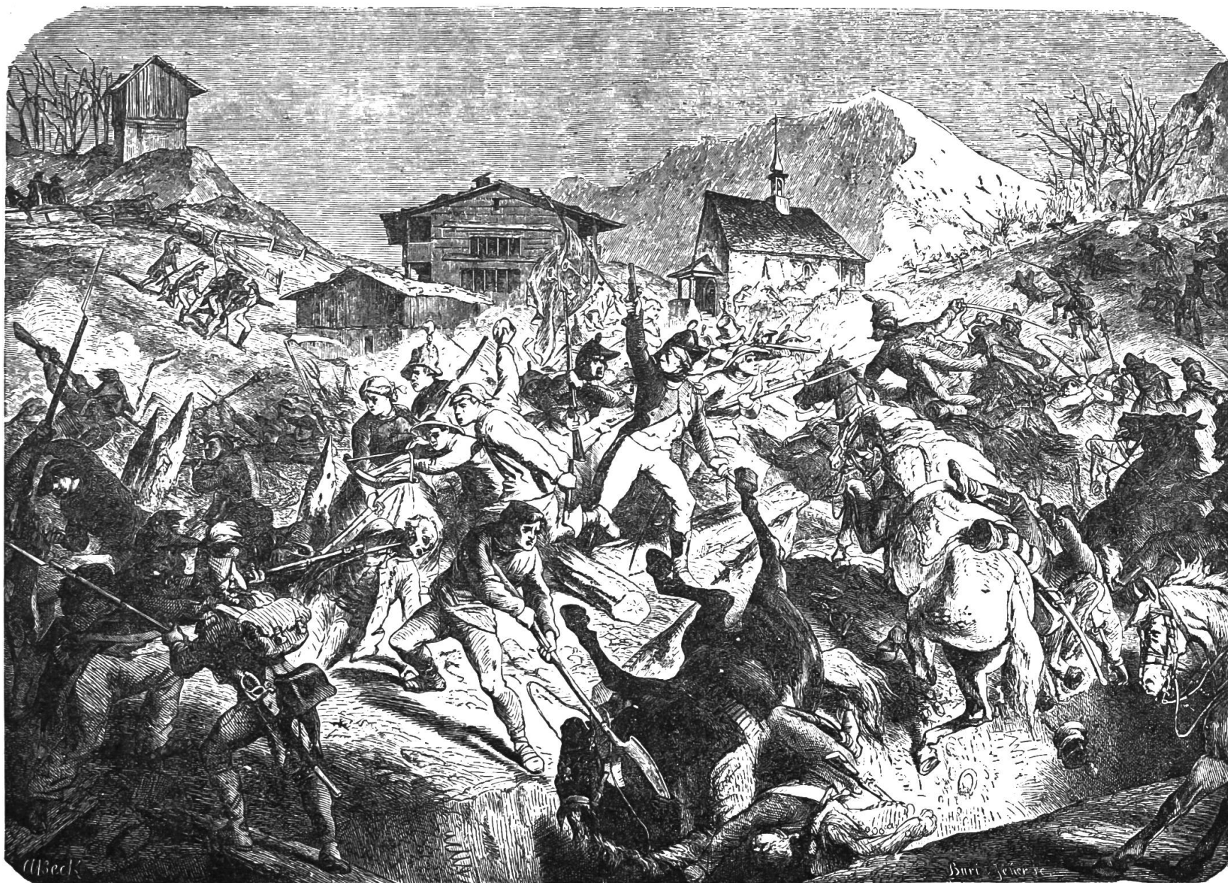
Der Kampf der Nidwaldner am Drachenried. 9. Sept. 1798. Aus der „Schweizergeschichte“ in Bildern mit Erlaubniß der J. Dalsp'schen Buchhandlung, Bern.