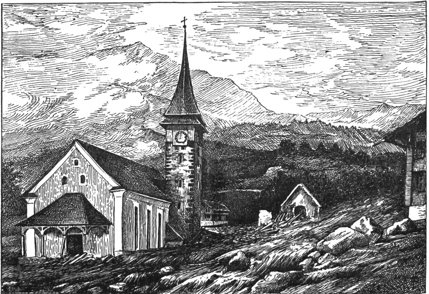
Die Pfarrkirche in Lungern nach der Ueberschwemmung vom 22. Juli 1887.

Schon damals sprach man lebhaft von einem Neubau der Kirche an sicherem Platze und diese