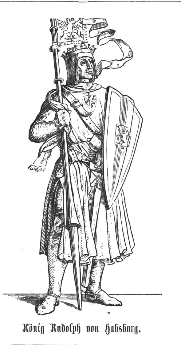
König Rudolph von Habsburg.

vorgedrückt war. 'S war so rechtes Sudelwetter, empfindlich kalt und der Himmel zeigte mehr Lust zum Schneien als zum Regnen. Eines Morgens war König Rudolph, seiner Gewohnheit gemäß, ziemlich früh aufgestanden. Er froh nicht wenig, denn das Zimmer war nicht geheizt, aus dem einfachen Grunde, weil es keinen Ofen hatte. Fröstelnd schaute er zum Fenster hinaus und bemerkte, daß seiner Herberge gegenüber ein Bäckerhaus stand, in dem schon alles vollauf beschäftigt war. Dem König kam der Gedanke sich da drüben am Kohlenfeuer zu erwärmen. Gedacht, gethan! — Um nicht erkannt zu werden, kleidete sich Rudolph in einen ganz gewöhnlichen Leibrock, wie ihn unbemittelte Dienst-