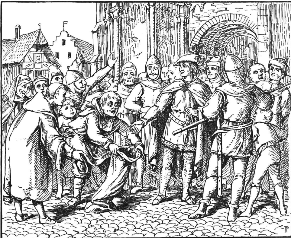
König Rudolph und der Schalksnarr.

Er war in 14 Schlachten Sieger, hatte viele Herren und Städte bezwungen, die sich vorher nie einem römischen König unterwerfen wollten. Er beehrte nicht nach Rom zu ziehen, um die kaiserliche Krone zu empfangen, obwohl ihm dabei nichts im Wege stand. Seines Hauses Erbe hinterließ er reich und mächtig seinem Sohne Albrecht. König Rudolph wurde