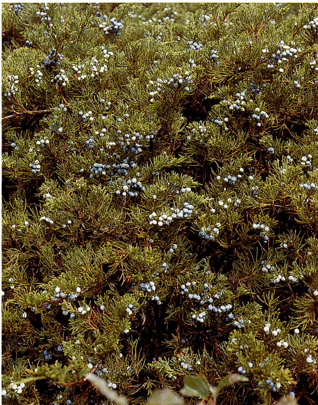
Abbildung 5 Fruchtendes Exemplar von Juniperus Sabina mit den blaubereiften Beeren bei Ramosch-Chants im Untergadin, 1320 m s.m., ca..