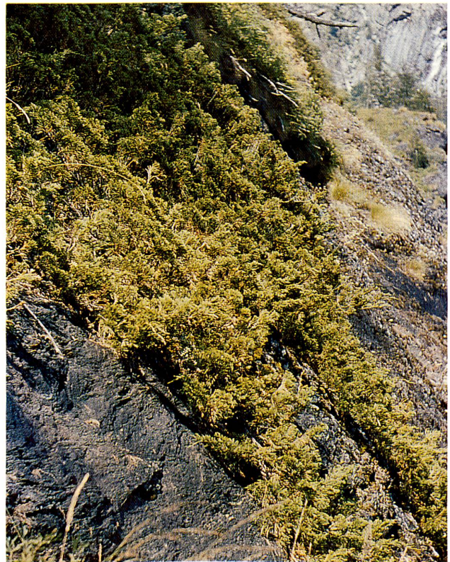
Abbildung 6 Juniperus Sabina als Spalierstrauch an einem westexponierten Felsabsturz von kalkhaltigem Bündner Schiefer in der Valle Quarazza (Valle Anzasca, Prov. Novara, Italien), am Saumweg nach dem Passo Turlo, 1550 m s.m., ca. (Foto: Alex Spinnler, Gelterkinden, 7. August 1954; Diathek Hans Peter Fuchs-Eckert, Nr. 28).