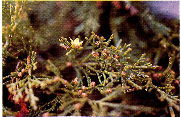
Abbildung 4 Blühendes Exemplar von Juniperus Sabina mit männlichen und weiblichen Blüten im Rhonetal bei Raafth oberhalb Ausserberg, 1470 m s.m., ca. (Foto: Hans Peter Rieder, Basel, 28. März 1991; Diathek Basler botanische Gesellschaft, Nr. 22454).