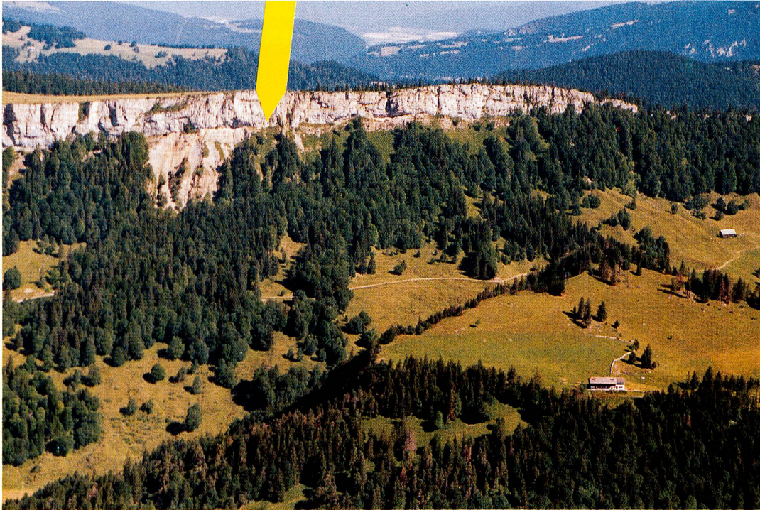
Abbildung 1 Luftaufnahme der Wandfluh. Der Fundort von Juniperus Sabina unterhalb der Spitze des gelben Pfeils.