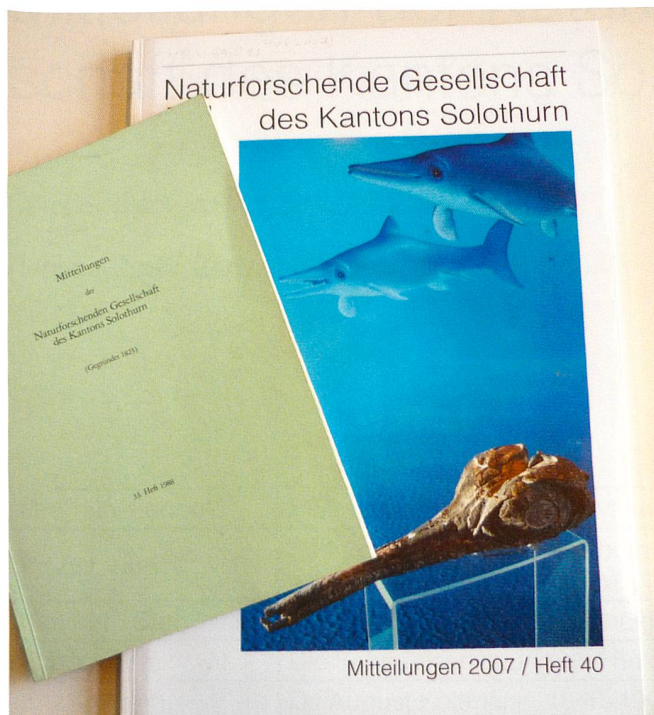
Abb. 4: «Mitteilungen» im alten und im neuen Format

das Wort «in» entfernt, ab 1963 erscheint der Kanton Solothurn im Titel. Im 29. Heft von 1980 findet sich ein Inhaltsverzeichnis für die Hefte 1 bis 28.