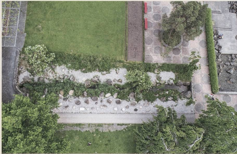
Freigelegt und beschriftet durch die NGL: die Findlinge am Churchill Quai.