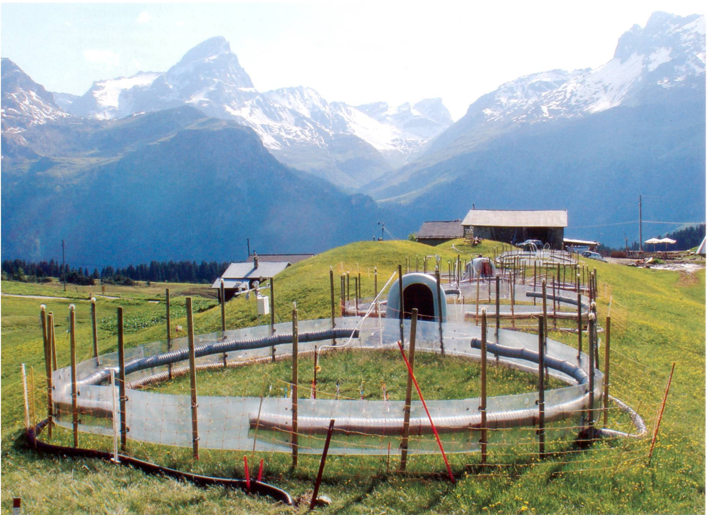
Abb. 1: Freiluftbegasungsanlage auf der Alp Flix.

Im Rahmen dieses Experiments wurden 180 Rassenziegel von 30 x 40 cm aus einer Ferkelkraut-Borstgras-Weide ausgestochen und einer Kombination von drei \text{O}_3 -Belastungsstufen (Umgebungskonzentration [UK], 1.2 x UK, 1.6 x UK) und fünf N-Stufen ausgesetzt (Hintergrundbelastung, +5, +10, +25, +50 \text{kg N ha}^{-1} \text{y}^{-1} ). Die Simulation von erhöhter \text{O}_3 -Belastung erfolgte mit einer Ozonbegasungsanlage. N wurde als Ammoniumnitrat im Giesswasser in 14-tägigen Abständen während der Vegetationsperiode ausgebracht. In einem zusätzlichen Experiment wurden die Auswirkungen einer Kombination von N- und Phosphor (P)-Zugabe untersucht. Der Einfluss von \text{O}_3 - und N- und P-Eintrag wurde anhand verschiedener Parameter gemessen (Biomasse, Artenvielfalt, \text{CO}_2 -Assimilation, NDVI [Normalized Difference Vegetation Index, Mass für die «Grünheit» der Vegetation], Blütenproduktion, Phänologie).