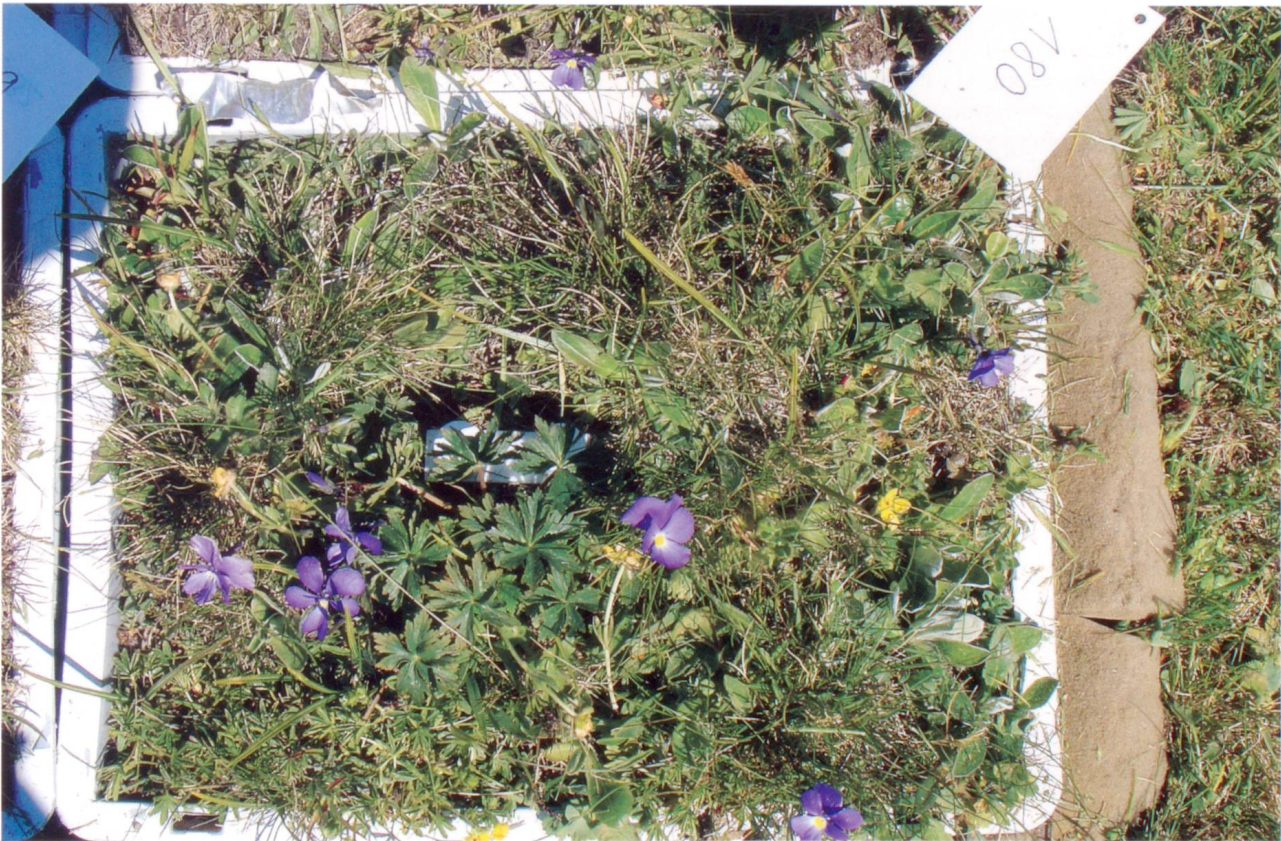
Abb. 2: Einer von 180 Rasenziegeln, welche unterschiedlichen Ozon- und Stickstoffkonzentrationen ausgesetzt wurde.