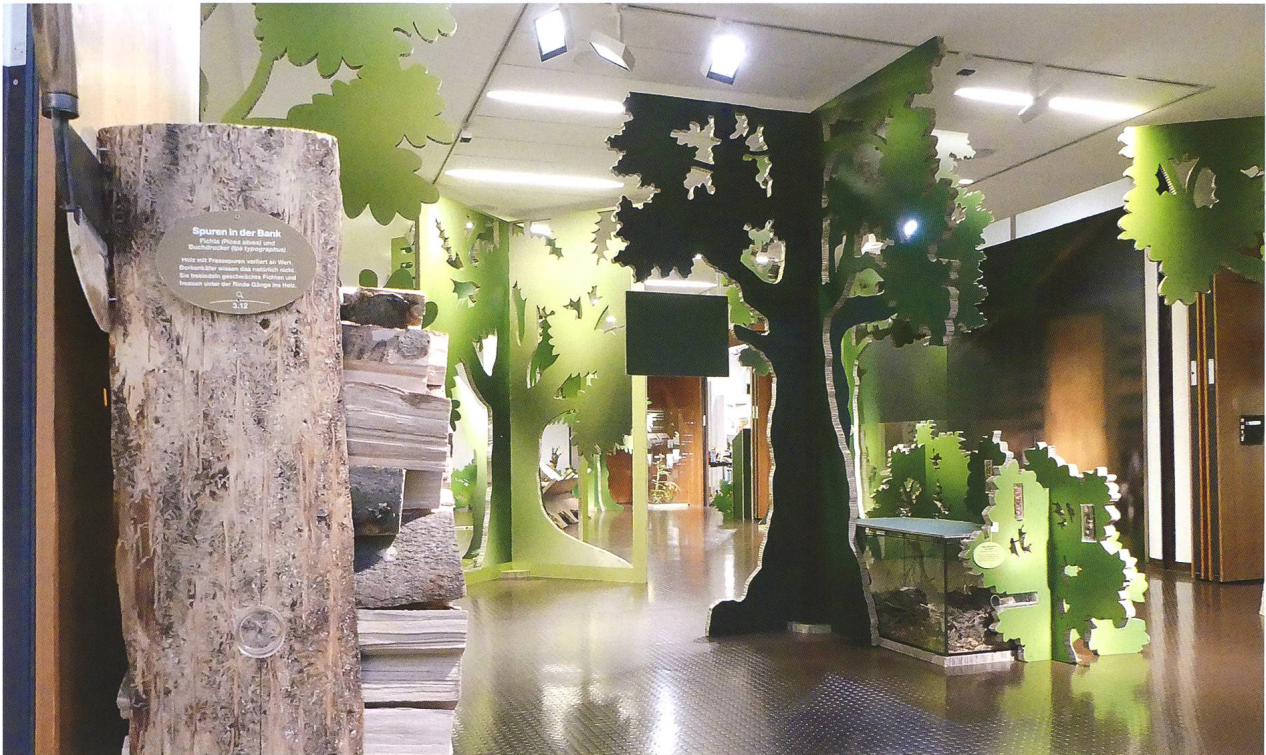
Abb. 3: Die Ausstellung «wild auf Wald» lud zu einem informativen Waldspaziergang ein.