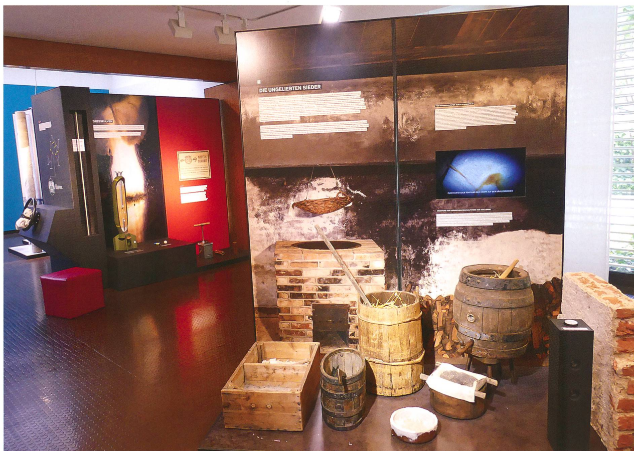
Abb. 2: Die Ausstellung «Grüner Klee und Dynamit – Der Stickstoff und das Leben» thematisierte biologische Aspekte, aber auch die gesellschaftliche und politische Bedeutung von Stickstoff.

Die Ausstellung «wild auf Wald» lud vom 13. September 2018 bis 20. Januar 2019 zu einem Spaziergang durch den Wald ein (Abb. 3). Der Wald ist ein dominierender Lebensraum Graubündens und der Schweiz. Er steckt voller Überraschungen, die zu entdecken die Ausstellung anregte. Da das Thema auch in den Schulen prominent behandelt wird, führten Flurin Camenisch und Praktikantin Stephanie Hosie fast im Dauerbetrieb Klassen durch die Ausstellung. Am 28. Oktober 2018 entführte Caroline Capiaghi Kinder und Erwachsene anlässlich der 2. Märchen- und Sagentage Chur ins Reich der Bäume (Abb. 4; vgl. auch Kapitel 6). Regierungsrat Dr. Jon Domenic Parolini hielt am 30. Oktober 2018 den Vortrag «Vom Kahlschlag zum Naturreservat – Zur Waldnutzungsgeschichte im Engadin, mit besonderem Augenmerk auf das Gebiet des heutigen Schweizerischen Nationalparks». Erstellt wurde die Ausstellung vom Naturama Aargau.