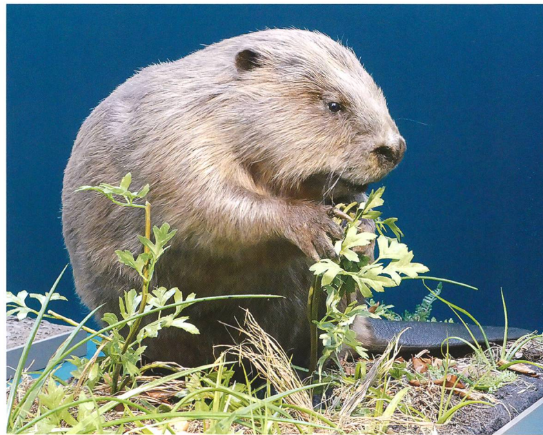
Abb. 1: Ein neu präparierter Biber aus der Schweiz ersetzt den historisch wertvollen «Elbebiber» in der Dauerausstellung.

Das speziellste neue Objekt in den Ausstellungen ist sicherlich ein Pazifikaucher, der Ende 2015 auf dem Silvaplanersee (Lej da Silvaplauna) tot geborgen wurde, nachdem er in den Tagen zuvor von unzähligen Interessierten bestaunt worden war. Diese Vogelart brütet in der Tundra Nordamerikas und Ostsibiriens und überwintert normalerweise im Pazifikraum. Vereinzelt wurden in Europa schon Tiere an der Atlantikküste festgestellt, jedoch noch nie im Binnenland. Wie und warum der Pazifikaucher den Weg ins Engadin